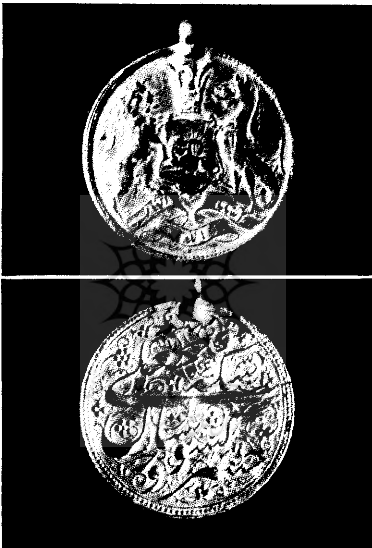
شکل ۲ - عکس رو و پشت سکه طلای فتحعلیشاه قاجار است که در موزه ایران باستان به شماره ۳۷۷ ضبط می‌باشد .