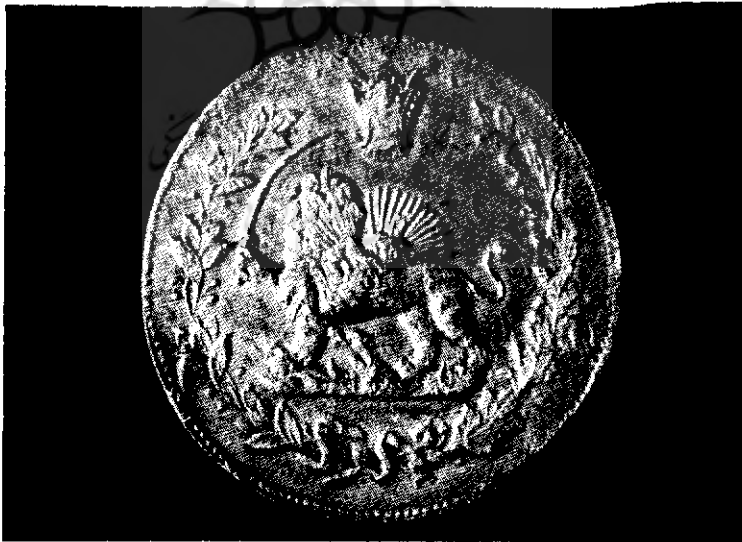
شکل ۵ - يك سيكه طلاي كم ياب از محمدشاه قاجار عكس رو و پشت.