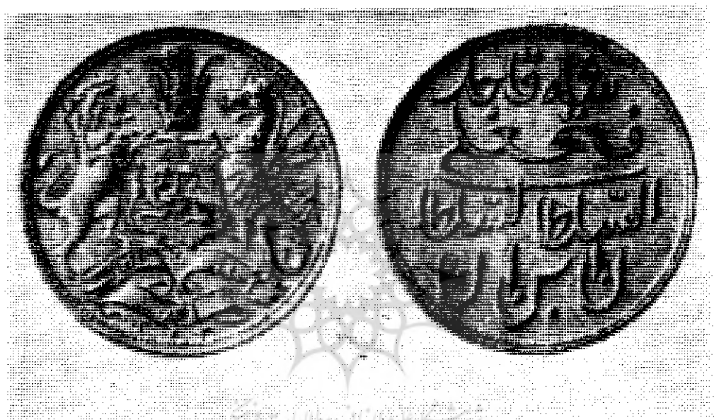
شکل ۱ - عکس رو و پشت سکه نقره ضرب انگلستان که در موزه بریتانیا به شماره ۵۴۲ ضبط است