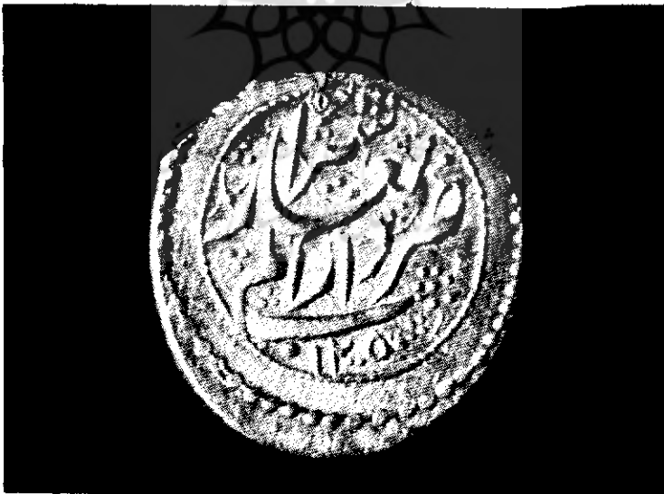
شکل ۴ - عکس رو و پشت سکه‌ای از حسینعلی میرزا فرمانفرما پسر فتحعلیشاه