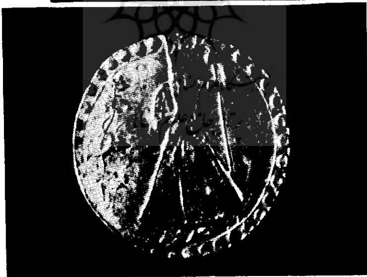
شکل ۳ - عکس رو و پشت يك سكهٔ بى نظير از فتحعليشاه كه به شماره ۳۷۷ در موزه ايران باستان ضبط است