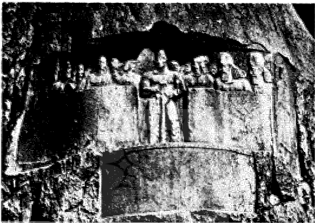
شکل ۴ - نقش برجسته بهرام دوم و افراد نزدیک خانواده و اطرافیان او در نقش رستم

پرتال جامع علوم انسانی روانشناسی و مطالعات فرهنگی