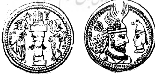
شکل ۳ - پشت و روی سکه بهرام دوم با ولیعهد