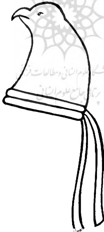
شکل ۹ - طرح تاج دوران