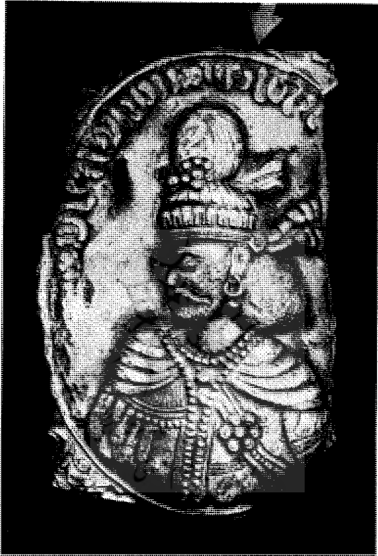
شکل ۱ - مدال بهرام سوم