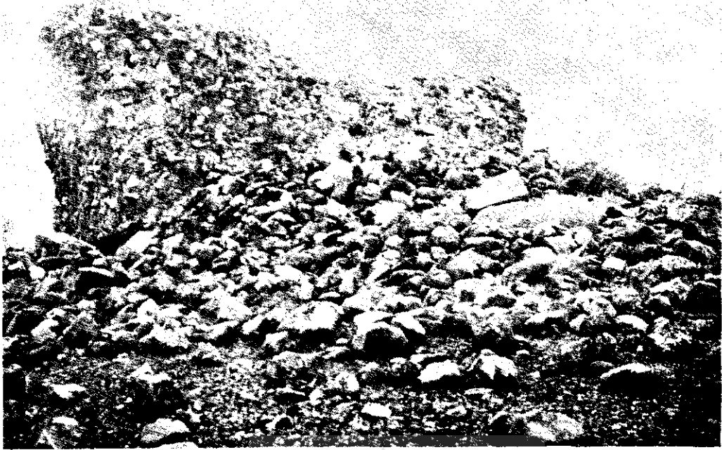
شکل ۸ - قسمت شمالی ویرانه پایکولی