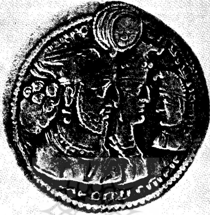
شکل ۲ - سکه بهرام دوم که با تصویر ملکه و ولیعهد او بهرام سوم (سمت راست) را هم دربر دارد