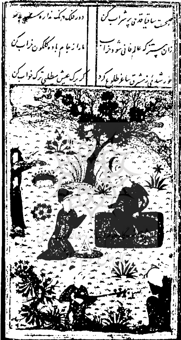
تصویری دیگر از مجالس نقاشی نسخه مورخ ۸۹۴ هـ ق (لیب).