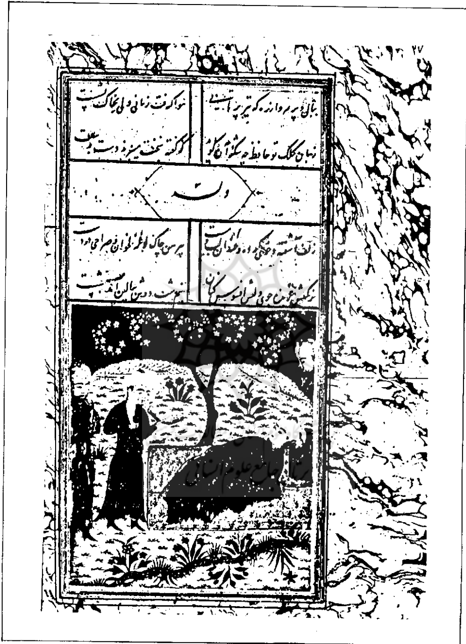
تصویریکی از مجالس نقاشی در نسخه مورخ ۸۹۲ هـ ق (لیب).