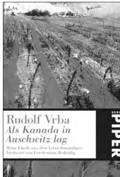
تصویر روی جلد کتاب دیگری که از خاطرات رادولف وربا منتشر شده است.

پیش نگرفتند، بنابراین، وربا نتیجه می گیرد که کل آن گروه روانه اتاقهای گاز شده اند. از آنجایی که کسی قصد شورش نداشت، وربا تصمیم به فرار گرفت و این کار را در ۷ آوریل ۱۹۴۴ انجام داد. او این موضوع را در فیلم شوآه به ما می گوید. طبیعی است که وقتی وربا با یکی دیگر از بازماندگان هولوکاست ملاقات می کند، تجربیات اردوگاهی وی موضوع بحث قرار می گیرد. کلاین از وربا پرسید آیا همکارانش می دانستند که طی جنگ چه بلایی بر سر او آمده است؟ در ابتدا، وربا به این پرسش پاسخ نداد. با این حال، بالبخندی تمسخرآمیز به این نکته اشاره کرد که یکی از همکارانش هنگامی که او را به صورتی غیرمنتظره در فیلم لانزمن دید، منقلب شده است. همکار او پرسیده بود آیا همه چیزهایی که در این فیلم اظهار داشته ای واقعاً حقیقت دارد،