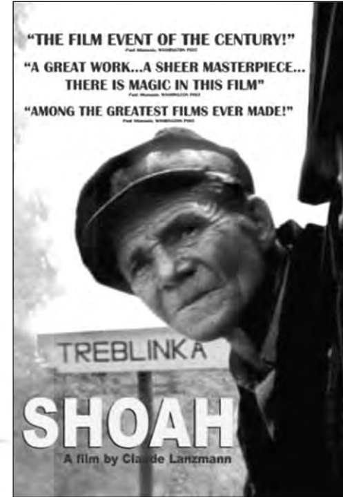
پوستر تبلیغاتی و تصویر روی جلد فیلم شوآه

فرض بر این است که تربلینکا صرفاً اردوگاهی برای نابودی یهودیان بوده است و به همین دلیل انتظار نداریم بعد از جنگ کسی در مورد آن شهادت داده باشد. با این حال، این داستان