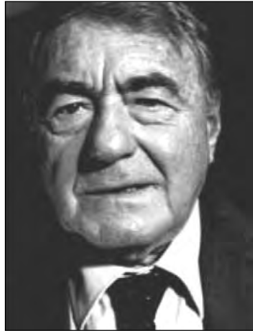
کلود لانزمن کارگردان فیلم به ظاهر مستند شوآه

تا با استفاده از آن مستندی درباره هولوکاست با هدف متقاعد کردن افراد بدبین (نسبت به این واقعه) بسازد، آن هم در زمانی که نهضت تاریخ حقیقی دل مشغولی گروهی از مردم بود. متعاقباً مبالغ دیگری نیز از طرف دولت فرانسه و منابع خصوصی به وی داده شد. این فیلم در سال ۱۹۸۵، یعنی هشت سال بعد به پایان رسید. در بخش تقدیر و تشکر فیلم، حتی یک کلمه در مورد دریافت کمک مالی از اسرائیل ذکر نشده است. بالاتر از آن، حتی یک کلمه در این مورد گفته نشده است که تمام شهود آلمانی شرکت کننده در این فیلم، ۳۰۰۰ مارک آلمان دریافت کرده بودند، ولی مجبور بودند تعهد دهند که تا سی سال در این مورد حرف نزنند. به این ترتیب شهود آلمانی به خاطر پول شهادت دادند.