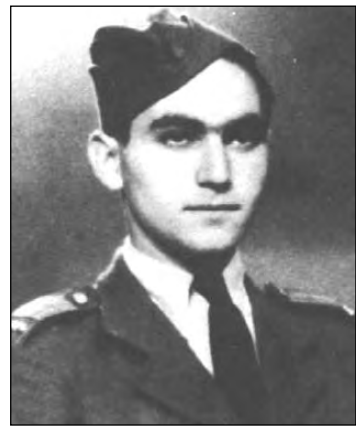
رادولف وربا پیش از جنگ جهانی دوم

گزارش منتشر شده‌ای که او پس از گریختن از آشویتس در شهر باری و در ۲۰ آوریل ۱۹۴۵ نوشته است «شهادت یک شاهد در مورد دو فراری از اردوگاههای کشتار جمعی آشویتس بیرکناو واقع در اسویه سیم ، لهستان» نام دارد. گفته می‌شود که متن منتشر شده در واقع ترجمه آلمانی متن اصلی از زبان مجاری است. در انتهای گزارش وربا و دوستانش جدولی با این عنوان وجود دارد: «تخمینی محافظه‌کارانه (توسط دو پناهنده) از تعداد یهودیان کشته شده در اردوگاه بیرکناو بین آوریل ۴۲ و آوریل ۴۳ - بر اساس ملیت آنها.»