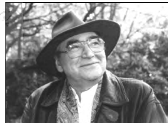
رادولف وربا در سال ۲۰۰۰

سکوی قدیمی پیاده شدند که تا محل سوزاندن اجساد دو کیلومتر فاصله داشت. او بعدها اظهار کرد که سکوی جدیدی برای ورود یک میلیون یهودی مجارستانی ساخته شد که قرار بود به سرعت نابود شوند. هر کس که سعی می کرد تازه واردها را در جریان اتاق گاز قرار دهد به قتل می رسید. علاوه بر اتاق گاز (محصول