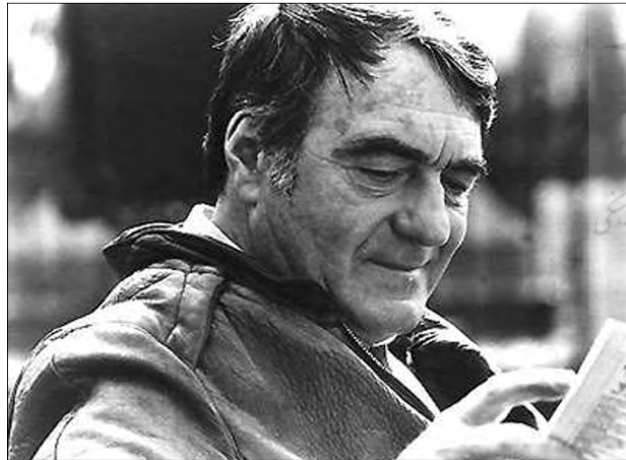
کلود لانزمن کارگردان فیلم به ظاهر مستند شواه

یک بررسی زمین شناسی و فیزیکی کامل از کل محوطه حتی امروز نیز تأیید خواهد کرد که آیا بررسیهای پزشکی قانونی لهستانیها در سال ۱۹۴۶ صحیح بوده است و به عبارت دیگر، آیا خاک داخل و اطراف تربلینکا محلی برای گورهای جمعی و سوزاندن اجساد در فضای باز بوده است یا خیر. ولی کلود لانزمن هرگز نمی خواهد که آن سنگها زبان به سخن باز کنند و احتمالاً دلایل خوبی نیز برای این منظور دارد، چون آنها با این کار تلاش یک عمر وی و اعتقادات محکم او را نابود خواهند کرد. در سال ۱۹۹۴، کلود لانزمن توضیح داد که چرا هیچ گونه شواهد مستندی یا پزشکی قانونی در فیلم خود نگنجانده است و تنها به شهادت (از نظر روان شناسی تأثیرگذار، ولی از نظر علمی غیرقابل دفاع) شهود اکتفا کرده است: