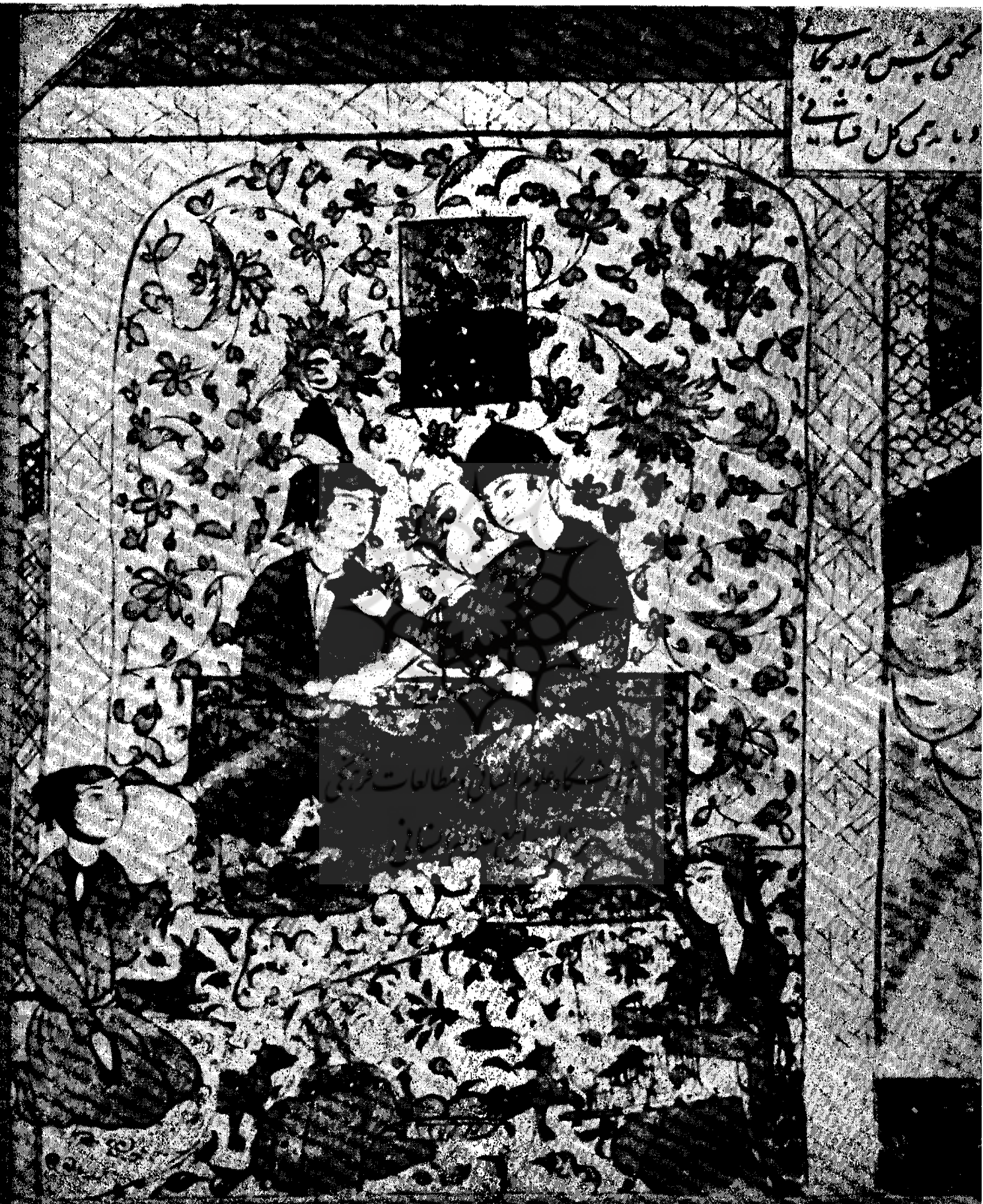
خمسعی نظامی : بهرام گور و دختر پادشاه اقلیم پنجم در زیر گنبد فیروزه . مکتب محلی جنوب ، اوخر سده شانزدهم میلادی