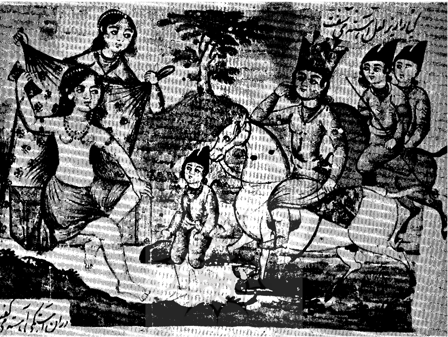
خمسه‌ی نظامی: خسرو پرویز شیرین را که در حال استحمام است، می‌نگرد. مکتب قاجار، سال ۱۸۴۳ میلادی

قزوینی است که ۷۳۵ برگ باندازه‌ی ۲۳×۱۳/۵ دارد و بخط نستعلیق نوشته شده و عناوین سرخ دارد؛ جلد آن نیز از چرم قهوه‌ای است.