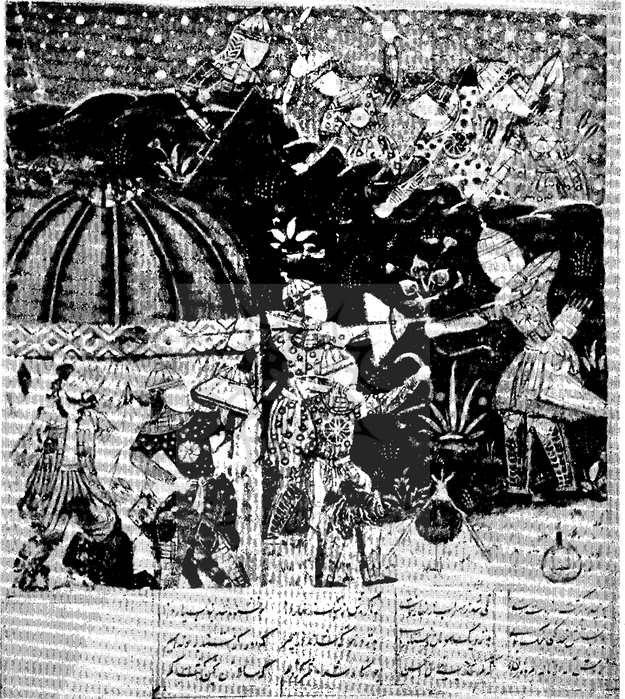
شاهنامه‌ی فردوسی : جنگ سهراب باهجیر در جلوی دژ سپید . مکتب محلی هندی، سده هجدهم میلادی

شرح صفحه مقابل : شاهنامه‌ی فردوسی : زن جادوگر سیبی را برستم می‌دهد. مکتب محلی مغولی، سده هجدهم میلادی