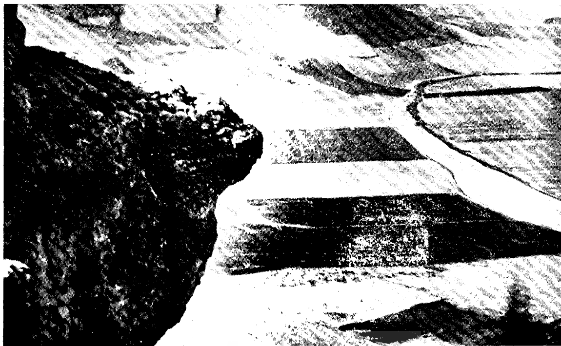
(به روی شمشیرخانی) سنگ شمشیرخان سنگی طبیعی که محل یرتگاه امیرخان وهمسرش بوده.

بخشی از سنگ چینی که احتمالاً متعلق به بوزلوق می باشد.