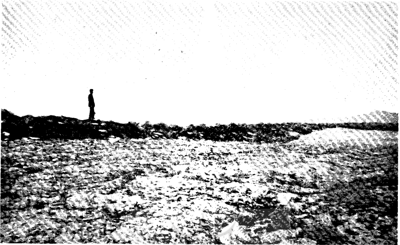
شخص ایستاده درست به روی راه مخفی آبرسانی قلعه است هم‌اکنون کانال مذکور از آجرهای قرمز چهارگوش و سنگ انباشته است .