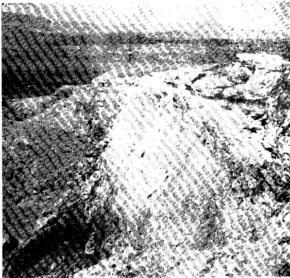
دیوار طبیعی ضلع جنوبی قلعه

۶ - اوشنی، اشنویه فعلی در غرب دریاچه رضائیه است این شهر تاریخی کهن دارد، کتیبه (کیلهشین) که باستانشناسان معتقدند در سال ۸۱۴ قبل از میلاد بدستور اشیونی پادشاه اورارتو در آن محل نصب شده خود معرف قدمت این شهر است کوروش نیز در اعلامیه آزادی خود از محلی بنام (اشنونا) اسم برده که با احتمال قوی باید همان (شنوی زبان کردی) و اشنویه فعلی باشد.