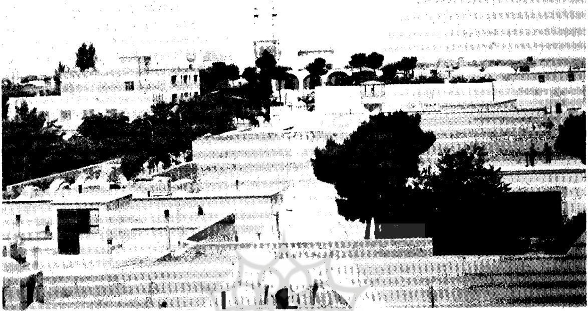
دورنمایی از گنبد سید رکن‌الدین و مسجد جامع یزد