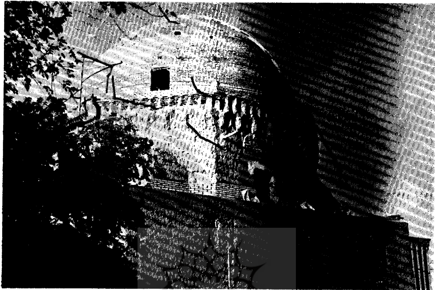
گنبد مدرسه ضیائیه یزد

درحال حاضر یکی از پایه‌های اقتصادی و صنعتی و نموداری است. فزاینده از هنر اصیل ایرانی کهن که درحال حاضر وسعتی را درحاشیه کویر بخود اختصاص داده است.