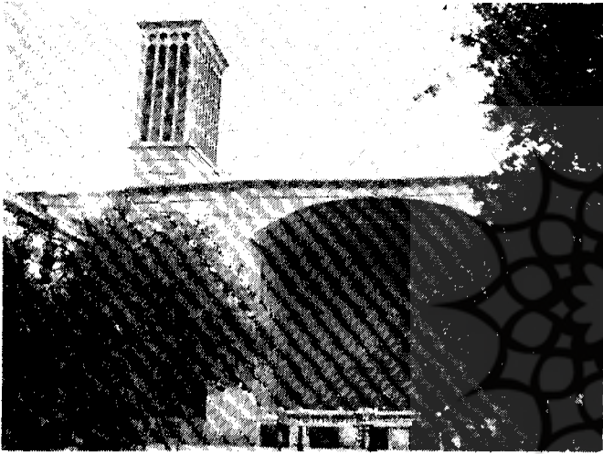
راست بالا: یکی از تکابای شهر یزد چپ بالا: بادگیری در شهرستان یزد پائین: نمای یک خانه قدیمی در یزد