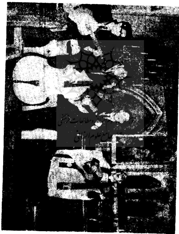
رقص و موسیقی در داخل کلیسا

حاصله از آنها بحساب واتیکان در بانکها ریخته میشود . هر توریست خارجی بخاطر عظمت این آثار حتماً بزیرات این موزهها و کلیساهای دیدنی مانند کلیسای سن پیتر میرود . طبق آماري که از طرف وزارت کشور ایتالیا در سال ۱۹۶۶ پخش شد در اینسال تعداد بیست و چهار میلیون توریست از این کشور دیدن کردند .