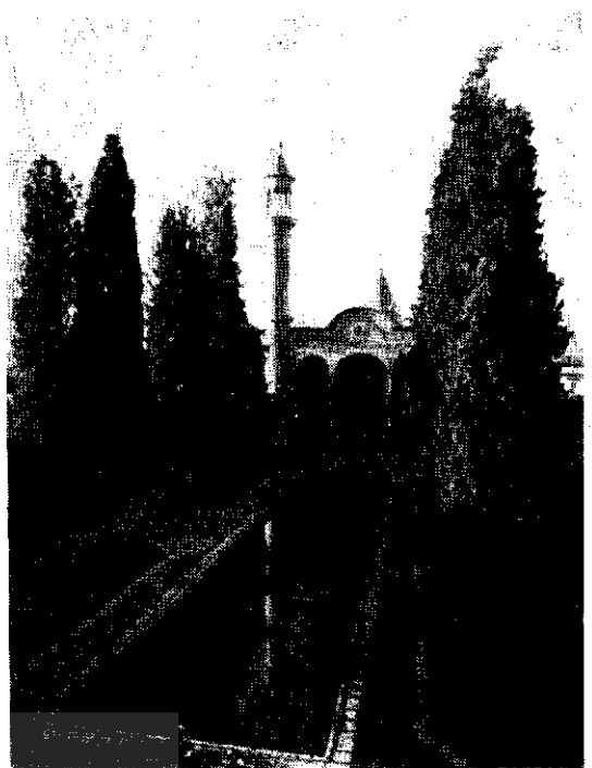
راست: شاهزاده ابراهیم

در پایان، ساختمان وسیع و زیبای باغشاه فین با موقعیت طبیعی و کثرت اشجار سروکهن و آب‌نماهای متعدد و فواره‌های آن و اینکه روزگاری محل پذیرائی و مقر پادشاهان صفوی بوده است موجب گردیده که بیشتر مسافرین و سیاحان خارجی مانند شاردن و فلاندین و کوست و ژ. دیو لافوا و پیتر دولواواله، در باب این باغ تاریخی شرحی برشته تحریر آورند که از مجموعه‌ی آن یادداشتها و تفصیلات، این‌نکته روشن میشود که این حدیقه تاریخی در نتیجه موقعیت خاص جغرافیائی و طبیعی که مشرف بر مناظر سرسبز شهر کاشان میباشد در اثر برکت آب فراوان چشمه سلیمانی که همواره در نهرها و جویبارها و حوضهای آن جریان دارد پیوسته مورد توجه خاطر پادشاهان صفوی و زنده و قاجار بوده و در عداد تفریحگاههای سلطنتی و تصور پادشاهی بشمار میرفته است، خوشبختانه حفاظت و مرمت این موقع تاریخی که برای شهر کاشان اهمیت و منزلت خاص دارد مورد توجه و مراقبت اداره کل باستانشناسی قرار گرفته است هم‌اکنون با تنظیم برنامه خاصی برای تکمیل تعمیرات و حفظ مناظر زیبای تاریخی باغ در نظر است که بهتر ترتیب شده است شکوه و جلوه روزگار آبادی خود را دریابد، تا در آینده نزدیک این باغ تاریخی که متضمن حوادث و وقایع تلخ و شیرینی در تاریخ سیاسی و اجتماعی ایران بوده است در عداد یکی از مراکز مهم بازدید جهانگردان و مشتاقان و طالبان دیدار نمونه‌ای از کاخهای سلطنتی ایران درآید.