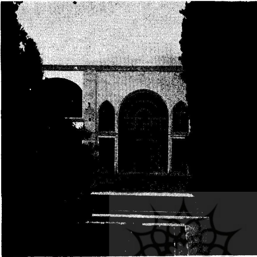
منظری از صفه دوطبقه باغ فین

لیکن آنچه مسلم است مجموعه‌ی باغشاه کنونی از بناهای دوره صفوی وزندیه وقاجار می‌باشد. شهر باران صفوی نظر بعلاقه خاصی که بشهرکاشان داشتند در انشاء ابنیه باغ وساختمان بناهای سرپوشیده وصفه‌های پرنقش ونگار آن با یکدیگر رقابت نموده‌اند، بطوریکه از استخوان بندی وآثار نقوش ورسوم بناهای چند طبقه وشاهنشین‌های آن معلوم میشود، منظور از ساختمانهای متفرق درون باغ بیشتر بخاطر رعایت جانب تقنین شاهانه بوده‌است، زیرا عمارات وسرپوشیده‌های تابستانی را بهر سو که مناظر آن زیباتر ودلبذیرتر بوده‌است پی افکنده‌اند، از این رو رعایت جهات ونکات معماری واستحکام نگردیده‌است، بنحویکه جهات ساختمان تابع مناظر طبیعی چهارگانه اطراف باغ ودورنمای شهر شده‌است، واز طرفی چون در تکمیل این قبیل ساختمانهای تفننی تسریع بعمل آمده آنطور که باید وشاید در دوام وقوام بنا توجه نشده وشتاب در اتمام بنا موجب عدم استحکام گردیده است، بهمین جهت دیری نیائیده که ابنیه سست بنیان بسرعت روبخوابی ووبرانی نهاده است، گرچه عوامل مهم دیگری چنانکه گذشت درواژگونی وانهدام وتغییر شکل ابنیه ومناظر دلچسب فضای باغ تأثیر داشته لیکن اثرات