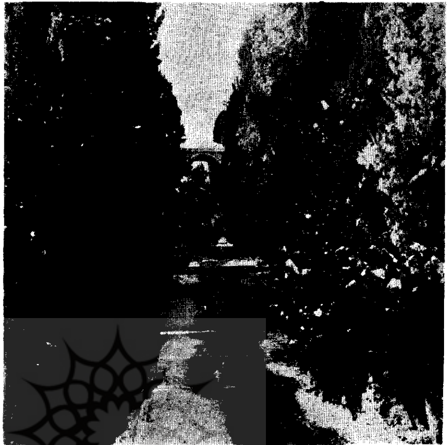
منظری از آب‌نما و جدول‌بندی خیابان باغ

آنچه در خانه‌ها مانده‌اند هلاک شده‌اند و بجائی که خانه‌های آن موضع بوده است پس از این زلزله بجز تل خاك از آثار ریح و دمن نشانی نماند» .