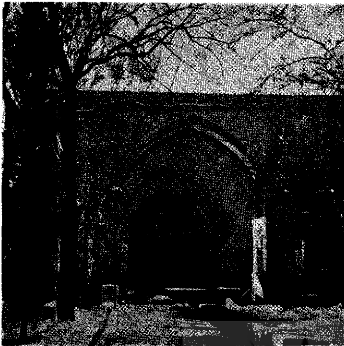
چپ: نمای صفا فتحعلیشاه باغ فین