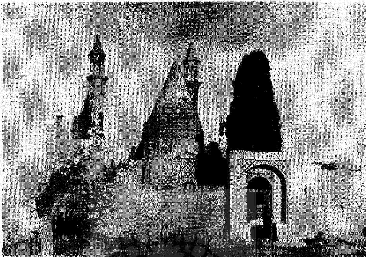
بقعه شاهزاده ابراهیم متعلق بدوران قاجار (سراش کاشان بقصبه فین)

سربوشیده که از چهار جهت بچهارشاه‌نشین تايستانی منتهی میگردد حوض بزرگی که همواره مملو از آب زلال چشمه سلیمانی است جلوه‌گری می‌نماید، جریان سریع آب درنهرهای اطراف که توأم با صدای ریزش آب از فواره‌های آن است حاکی از آبادی و شکوه این باغ مشهور و معروف است.