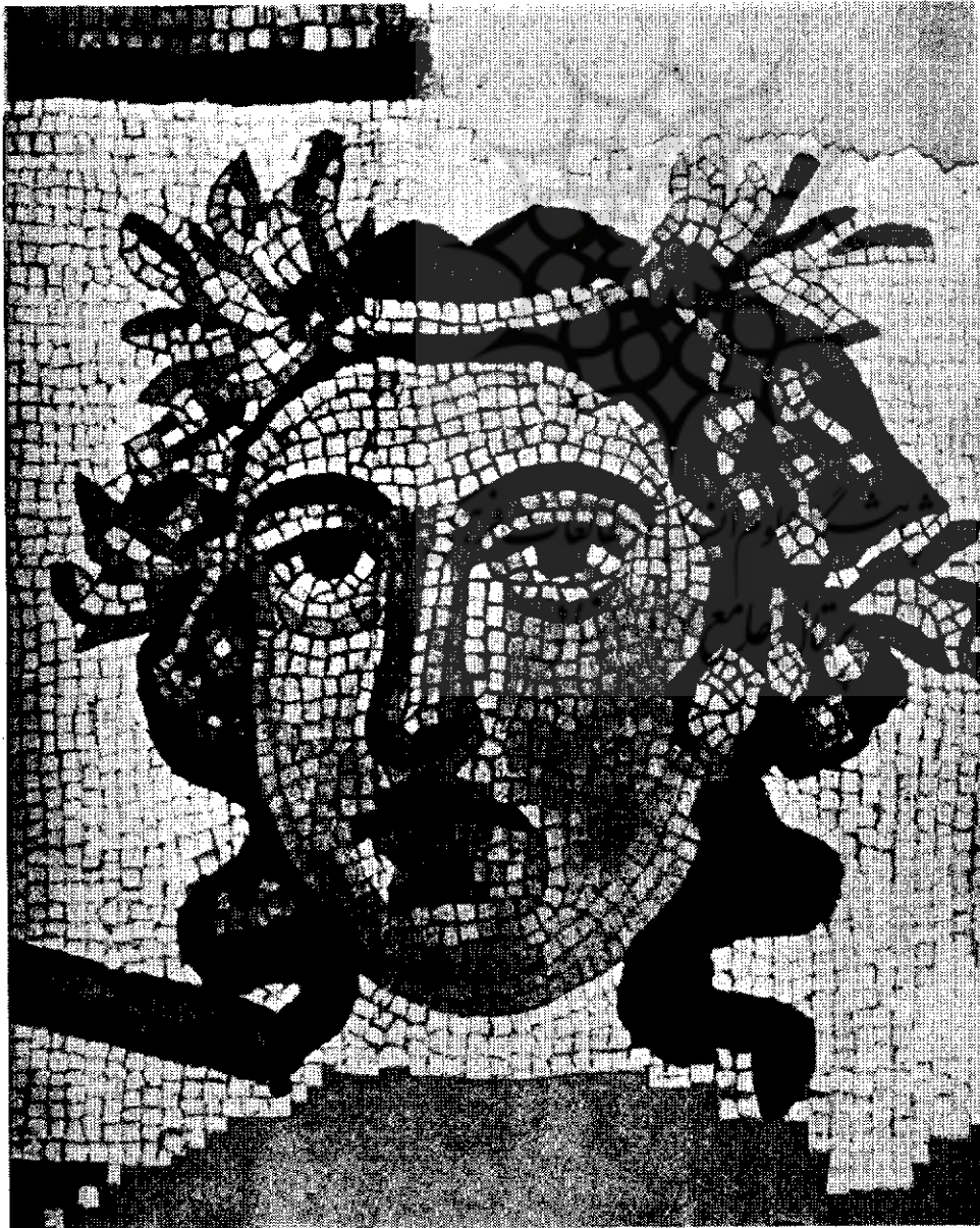
قسمتی از موزائیک‌های پیداشده در شهر بیشاپور نزدیک کازرون . دختر جوانی از خاندان شاهپور اول که تاجی از گل بر سر دارد و امروز در موزه تهران محفوظ است

نمی‌آمد . میگویند هنر از طبایع خداوندی است و موقعی میتوان هنری را بمنزله شاهکاری بحساب آورد که هنرمند بتواند حس ابتکار و خلقت را که خداوند به انسان عطا فرموده بکار برد . بنابراین اگر هنرمندی شاهکاری بوجود آورد ، هنرمند دیگر نمیتواند همان شاهکار را تقلید کند ، و به‌عنوان شاهکار دیگری معرفی نماید ، ولی میتواند با اقتباس از شاهکار اولی ابتکاری بخرج دهد که چیز جدیدی بوجود آورد . مساجدی که در زمان صفویه در ایران ساخته شد بدون شك زیباترین بناهایی بود که تا آن زمان در دنیا بوجود آمده بود ، و لسی امروز با وجود پیشرفت فوق‌العاده‌ی وسایل معماری و مصالح آن ، کسی در کشور ما پیدا نمیشود که خانه‌ای شبیه به مسجد شاه اصفهان بسازد . مسجد شاه اصفهان خود تقلیدی