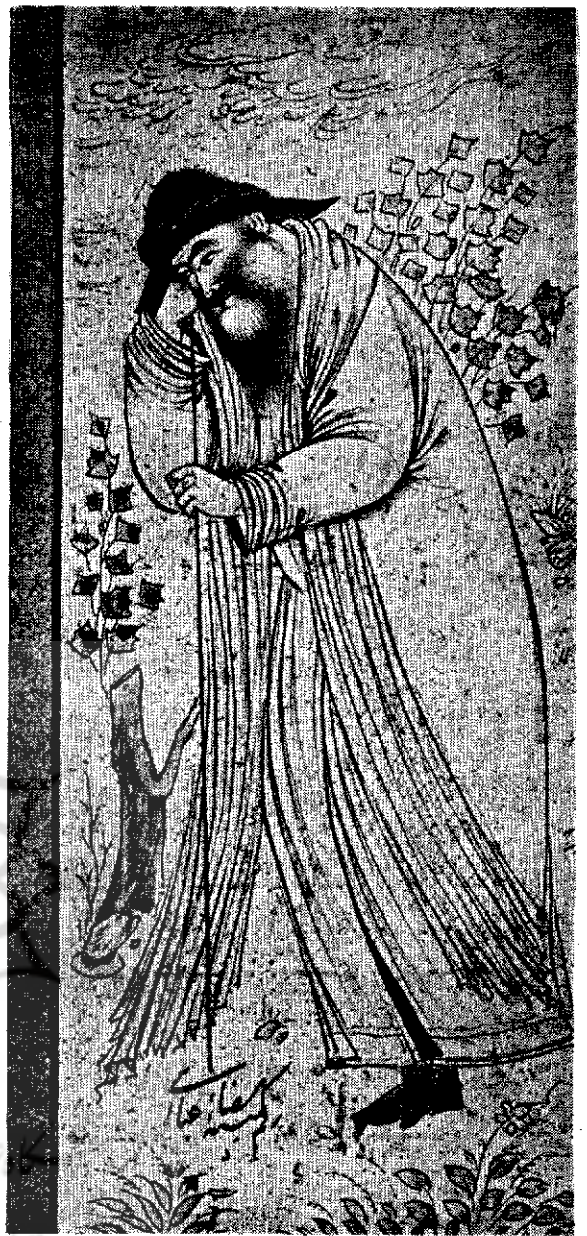
تصویر مردی پیر از رضای عباسی عهد صفویه - ابتدای قرن ۱۷

دوم بر اثر توجه مستشرقین با آثار ایران هیئت های باستان شناسی فرانسوی که در اوایل قرن بیستم بایران آمدند ضمن کاوش های علمی و کشف آثار باستانی، کتب خطی دارای مجالسی مینیاتور قدیمی و قطعات نقاشی قدیم ایرانی را جمع آوری میکردند و در این جستجو بتدریج کلمه مینیاتور را متداول کردند. در سال ۱۳۰۹ شمسی که بامر اعلیحضرت فقید رضاشاه کبیر بمنظور تجدید حیات هنرهای ملی ایران مؤسسه صنایع قدیمه تأسیس گردید و مقرر شد رشته های نقشه کشی قالی و کاشی و مینیاتور - تذهیب - زری بافی - منبت کاری - خاتم سازی و غیره ایجاد گردد روی کلمه مینیاتور بحثی مفصل بعمل آمد و در نتیجه آن کلمه نقاشی را بنقاشان کلاسیک اختصاص دادند و رشته مینیاتور را بهمان لغت اروپائی مینیاتور نامیدند و از آن تاریخ رسماً کلاس مینیاتور در مؤسسه صنایع قدیمه افتتاح شد و بتدریج کلمه مینیاتور در زبان فارسی رایج و مصطلح گردید تا امروز که هر کسی معنی کلی و مفهوم آنرا خوبی میفهمد.