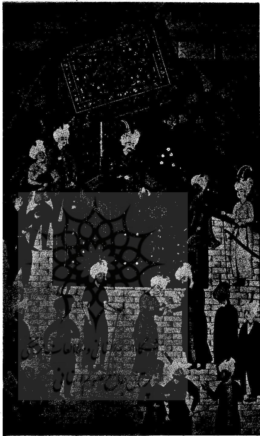
نشستن خسرو بر تخت - از خیمه نظامی - عهد صفویه