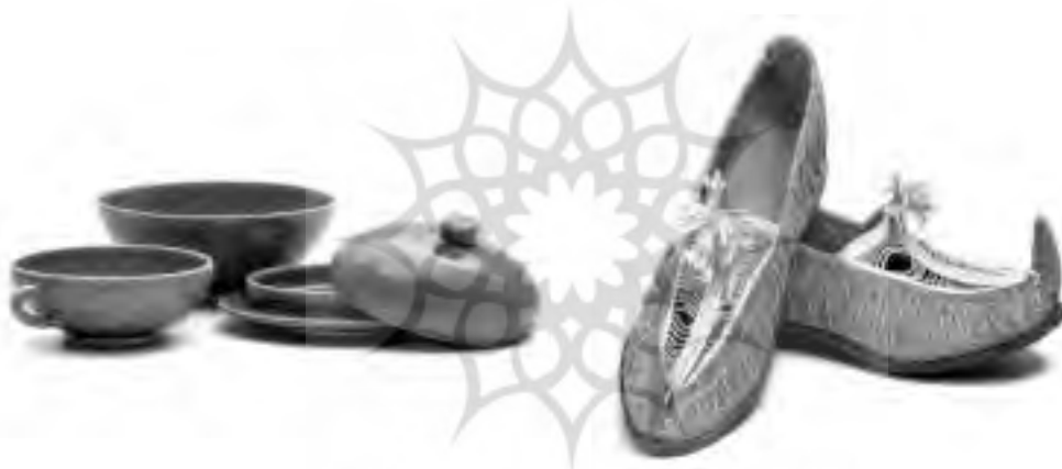
تصویر ۱۵ - کفش چرمی زنجان / تصویر ۱۶ - سرامیک تبریز

پرونده علمی پژوهشی انجمن علمی فروش ایران شماره شش و هفت بهار و تابستان ۱۳۸۶ ۱۶۸ پرونده علمی پژوهشی انجمن علمی فروش ایران شماره شش و هفت بهار و تابستان ۱۳۸۶ ۱۶۸ پرونده علمی پژوهشی انجمن علمی فروش ایران شماره شش و هفت بهار و تابستان ۱۳۸۶ ۱۶۸