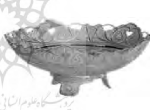
تصویر ۸، ظرف ملیله نقره کاری زنجان، مأخذ: آرشیو سازمان صنایع دستی ایران