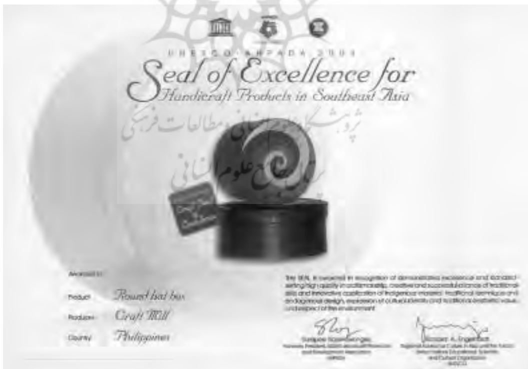
تصویر ۱ - نمونه مهر اصالت

مهر اصالت، گواهینامه‌ای است که یونسکو و دفترهای فرهنگی - هنری منطقه‌ای مشترکاً برای حفظ، احیا و تداوم فعالیت حرفه‌ای ارزشهای بومی و سنتی، به صنایع دستی اصیلی اعطا می‌کند که هنرمندان و صنعتگران با مهارت‌های حرفه‌ای، الگوها و مفاهیم سنتی را ابداع و نوآوری نمایند.