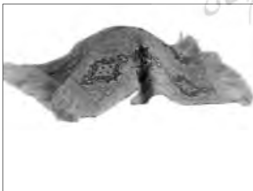
تصویر ۱۱- زری بافی اصفهان