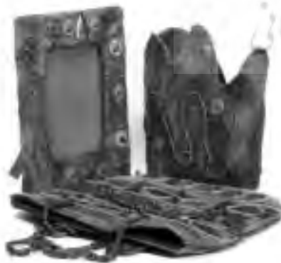
تصویر ۱۸ - لیاف طبیعی بم (لیف درخت خرما)

پرونده علمی پژوهشی انجمن علمی فروش ایران شماره شش و هفت بهار و تابستان ۱۳۸۶ ۱۶۸ پرونده علمی پژوهشی انجمن علمی فروش ایران شماره شش و هفت بهار و تابستان ۱۳۸۶ ۱۶۸ پرونده علمی پژوهشی انجمن علمی فروش ایران شماره شش و هفت بهار و تابستان ۱۳۸۶ ۱۶۸