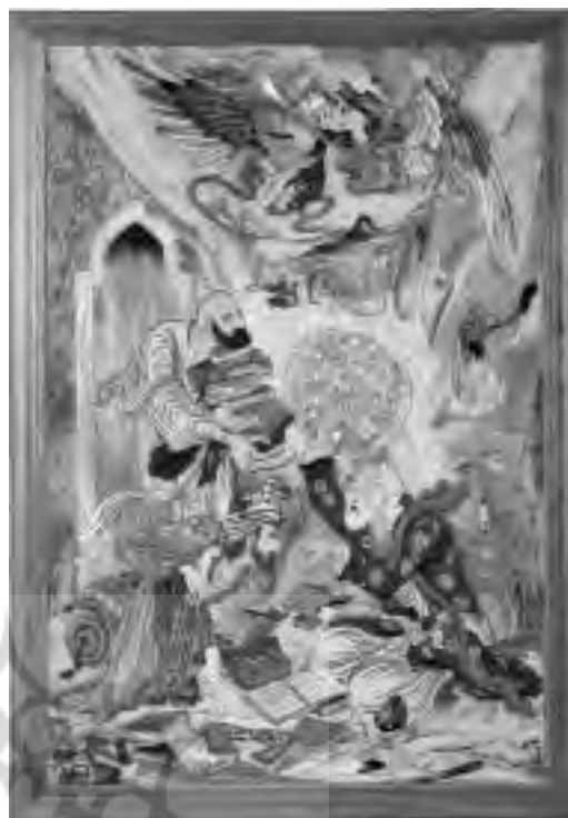
تصویر ۲ - تابلو معرکه مینت