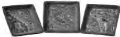
تصویر ۱۳ - سرامیک تهران