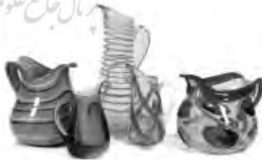
تصویر ۱۷ - شیشه تهران