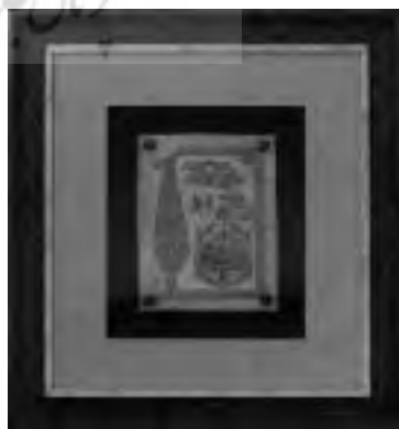
تصویر ۱۰، تابلو قلم زنی اراک