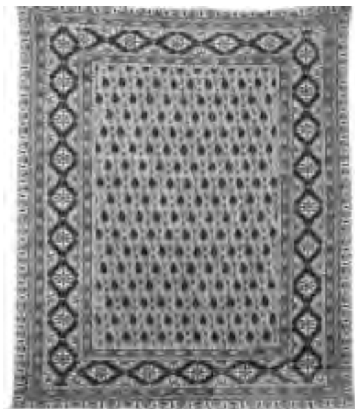
تصویر ۷، رومیزی قلمکار اصفهان