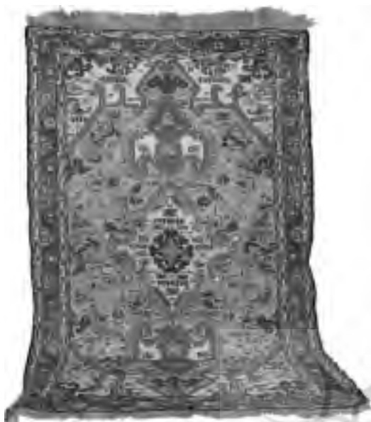
تصویر ۳، گلیم ورنی آذربایجان شرقی