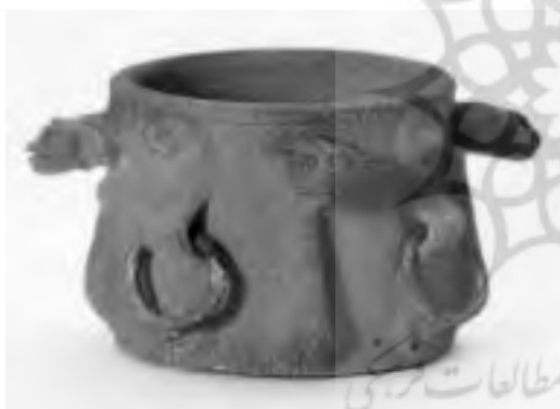
تصویر ۹- سفال سمنان، مأخذ: آرشیو سازمان صنایع دستی ایران