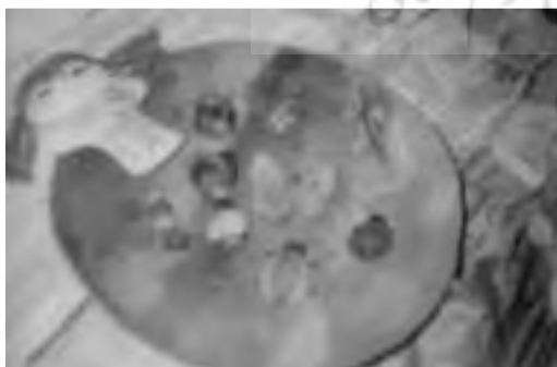
تصویر ۲۲ - اشکال نمادین