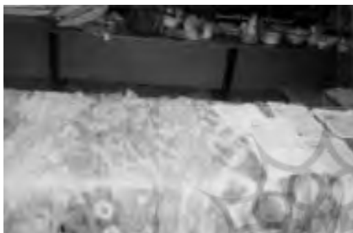
تصویر ۲۰ - روسری های تلفیقی