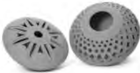
تصویر ۱۴ - سرامیک مازندران