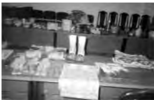
تصویر ۱۹ - اشیاء سفالی و پوتین

از طرف دیگر، اقلام کوچک و ارزان قیمتی چون روسری و شال ابریشمی و نمادی با رنگبندی و طراحی و تلفیق جالب، عروسکهای نمادین برخی کشورها، جواهر آلات بدلی و سفالینه‌هایی که با رعایت ابداع و نوآوری و قابلیت ارائه به بازارهای خارجی، در نهایت سادگی و ملحوظ داشتن جنبه کاربردی مشخص، ساخته و پرداخته و ارائه شده بودند، به راحتی مهراسالت دریافت کردند. بنابراین می توان گفت قیمت و کیفیت بالا، شکل یا اصیل بودن اثر به تنهایی ملاک موفقیت نیست و به جنبه‌هایی چون رقابت پذیری، بازار داری و کاربری مصنوع نیز باید توجه کرد.