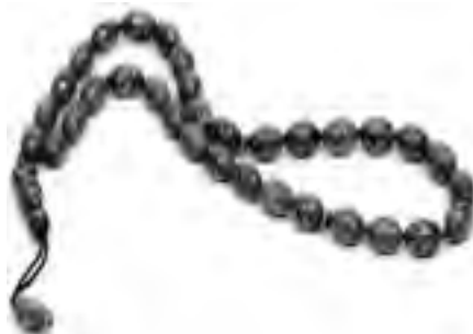
تصویر ۵، تسبیح چوبی نقره کوب آذربایجان شرقی