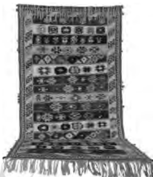
تصویر ۶، گلیم قشقایی فارس