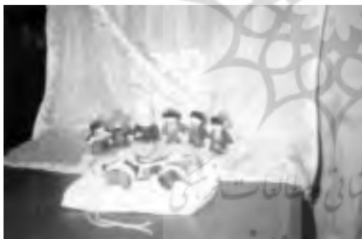
تصویر ۲۱ - عروسکهای نمادی