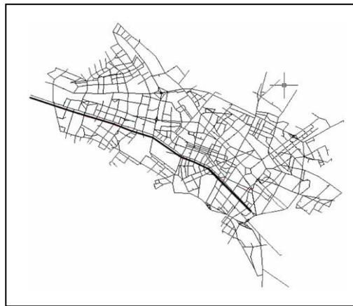
شکل 1. مسیر 1 از جدول 3 روی شبکه خیابانی مشهد