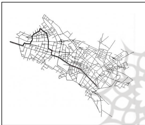
شکل 5. مسیر 8 از جدول 3 روی شبکه خیابانی مشهد