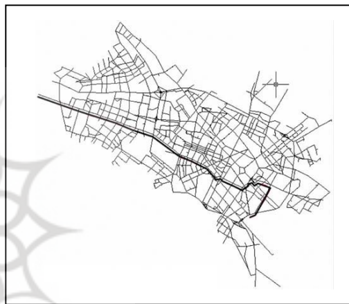
شکل 2. مسیر 5 از جدول 3 روی شبکه خیابانی مشهد