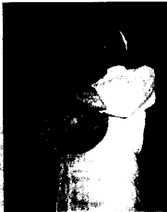
(در عکس نوازنده بوشهری را می‌بینید که در حال نوازدگی نی‌انبلان است.)

می‌شود که معمولاً پس از زدودن موها از روی پوست و همین‌طور خارج کردن رطوبت اضافه، آن را در حنا می‌گذارند و پس از خشک شدن آن را با روغن کنجد نرم می‌کنند. مشک دارای شش خروجی است که سه تایی آن که مربوط به دو پا و قسمت تحتانی بز می‌باشد را با هم از داخل جمع کرده و می‌بندند، گردن را نیز به همان شکل بسته، دو دست را هر کدام جداگانه یکی به منظور دسته نی‌انبلان و دیگری را به منظور ورودی هوا (دهنی) در نظر می‌گیرند و اما دسته، دسته از دو نی (که هر کدامش شش سوراخ بر آن تعبیه