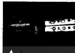
(نی انبانی که در بالا مشاهده می‌شود به نام TULUM از کشور ترکیه می‌باشد.)