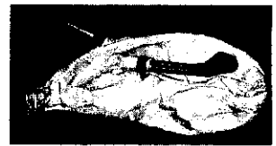
(ساز که در عکسهای فوق می‌بینید از این خانواده بوده و از کشور تونس می‌باشد به نام Zukra)

می‌نواختند می‌توان به برازجان اشاره داشت مردم این ناحیه که غالباً دامپرور و کشاورزند این ساز را به گونه‌ای دیگر می‌نوازند، مشک را بر دوش خود گذاشته و یکسره در آن می‌دمند (همچون نوازندگی سرنا و یا نی جفتی).