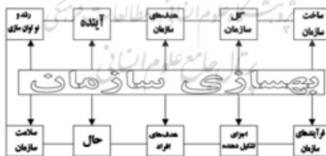
شکل ۲: ابعاد گوناگون تأثیرگذاری بهسازی سازمانی

«روش فرمان، روش تعویض شغل، روش ساختاری، روش تصمیم‌گیری، روش بحث در مورد داده‌ها، روش حل مسئله و روش گروه t» ۲۳ . لازم به یادآوری است که روش‌ها و فنون مورد استفاده در بهسازی، به روش‌های ذکر شده منحصر نیست؛ بلکه صاحب‌نظران شیوه‌های متعددی را برای این منظور معرفی کرده‌اند که برای رعایت اختصار، از ذکر آن‌ها خودداری می‌کنیم. ولی در یک تقسیم‌بندی کلی، می‌توان این روش‌ها را در دو گروه ساختارگرا و فرآیندگرا قرار داد که هر یک بر ابعاد و جنبه‌های خاص سازمان و مدیریت تأثیر می‌گذارند. شکل زیر نشان‌دهنده این ابعاد و جنبه‌های گوناگون آن است: