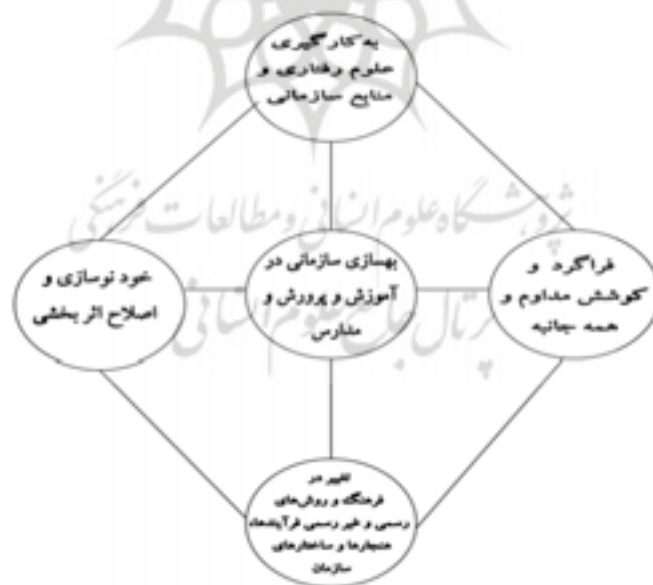
شکل ۱: فراگرد بهسازی سازمانی در آموزش و پرورش

بر این اساس می‌توان گفت منظور از بهسازی سازمانی در آموزش و پرورش یک فراگرد، کوشش همه جانبه و برنامه‌ریزی مداوم برای ایجاد تغییر در جنبه‌های متفاوت سازمانی آموزش و پرورش و مدارس است که در آن، از علوم رفتاری و منابع متعدد و روش‌ها و فنون مناسب استفاده می‌شود. هدف اساسی و مهم آن هم اصلاح و بهبود اثربخشی آموزش و پرورش، مناطق آموزشی و مدارس است. شکل زیر، خلاصه‌ای از این فعالیت و اقدام سازمانی را نشان می‌دهد: