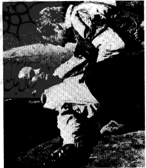
در جست و جوی پناهگاه

پذیرش زندگی شامل پذیرش ناآرامی‌ها و سختی‌های آن نیز می‌باشد. شخصیت‌های «ری» حساسیت‌های او را نسبت به زمان گذشته نیز بازگو می‌کنند. و بنا چنین می‌گوید: «من در این جا حاضر شده‌ام که زنده‌زنده بسوزاندم، آن هم در قرن بیستم!» «اما» در جهت مخالف آرزوی تغییر و بازگشت به گذشته را دارد: «تو هیچ قطاری که بگذرد، صدا کند و سوت بکشد، نخواهی دید!» کریستوفر پلامر دعوت جمع‌آوری اعانه برای گسترش شهر میامی را رد می‌کند «پیشرفت، چیزی که هرگز با آن موافق نیستم». ریچارد