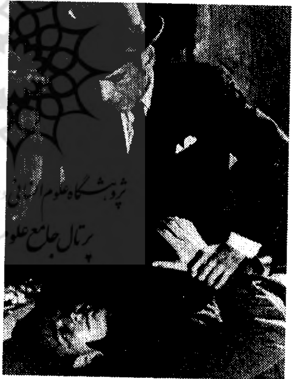
به هر دری بزن

برای مثال، کارگردان‌های بسیار معدودی به لوکیشن و دکور اهمیت می‌دهند، تأثیر آن را بر فیلم می‌شناسند و در این زمینه قوی هستند. از نظر انتقادی، لوکیشن فیلم باید با فضا و طرح فیلم رابطه‌ای اصولی داشته باشد اما تا زمانی که لوکیشن مناسبی در فیلم وجود نداشته باشد انسان متوجه تأثیر عظیم آن نمی‌گردد. در فیلم‌های «ری» دکور تمام آن چیزهای قابل دیدن است که شامل ساعات شبانه روز نیز می‌شود (او در این زمینه واقعاً استثنائی است). حساسیت ویژه «ری» بر زمان بیننده را وامی‌دارد که فی‌المثل شب را به عنوان چیزی بیش از نبود نور خورشید حس کند. اولین سکانس فیلم یاغی بی هدف مثال‌های فراوانی از این حساسیت ویژه داراست. در اینجا «ری» به هنگام بعد از ظهر شبی مصنوعی را به نمایش می‌گذارد. این حس غریب از زمان که مخصوصاً برای تقویت مفهوم این سکانس ایجاد شده در حقیقت نمایشگر کلیت ساختار فیلم می‌باشد. شب زمانی است که والدین در خواب هستند و زمان شورش و در عین حال ناامنی است. خود