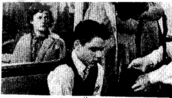
یاغی بی هدف

«ری» اعتقاد دارد سینما رسانه‌ای ارتباطی است و شفافیت و صراحت آن در درجه اول اهمیت قرار دارد. به همین علت بی‌ابهامی و روشنی موضوع در فیلم‌های او معمول است. این نگاه «ری» شاید بازتابی باشد از ساختار فیلمنامه‌هایش. شخصیت‌های اصلی فیلم‌های او تا حد ممکن سریع معرفی و شناخته می‌شوند. اولین نما معمولاً قهرمان اول را معرفی می‌کند و تا پایان اولین نقطه عطف همه روابط مهم ارائه شده‌اند. اما برای این حکم استثنائاتی نیز وجود دارد. برای مثال فیلم‌های