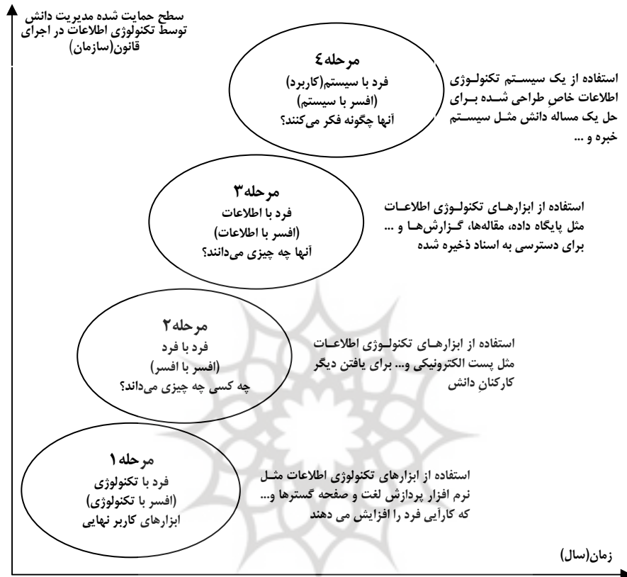
شکل شماره (۴): الگوی مرحله‌ای سیستم‌های مدیریت دانش برای تحقیقات (Gottschalk, 2006)