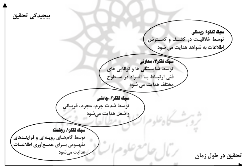
شکل شماره (۲): شیوه‌های تفکر درباره فرایند تحقیق (Dean, 2005)

دین ۱ پدیده روان‌شناسی شناختی ۲ را بازپرسی پلیس می‌نامد. کارآگاهان (بازپرس‌ها) هنگام هدایت یک تحقیق جنایی چگونه فکر می‌کنند؟ روان‌شناسی شناختی بر فرایندهای ذهنی و رفتارهای پیچیده موجود در حل مسأله و تصمیم‌گیری تمرکز دارد. (Dean, 2005) دین می‌گوید که تحقیق به طور اساسی یک بازی ذهنی ۳ است. هنگامی که آن به مرحله حل مسأله جنایی می‌رسد توانایی کارآگاه به عنوان یک محقق بیشترین اهمیت را دارد. چهار شیوه متفاوت تفکر عبارت است از تحقیق به عنوان روش، تحقیق به عنوان چالش، تحقیق به عنوان مهارت و تحقیق به عنوان ریسک. همه این چهار شیوه تحقیق جنایی می‌توانند به عنوان بخش و جزیی از کل پدیده تحقیق نگریسته شوند. در شکل شماره (۲) این چهار شیوه (سبک) متفاوت تفکر درباره فرایند تحقیق توسط کارآگاهان نشان داده شده است.