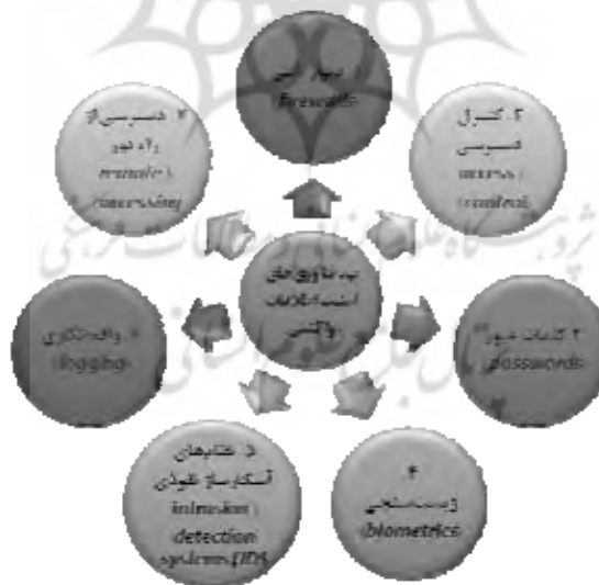
شکل شماره (۲): فناوری‌های امنیت اطلاعات واکنشی