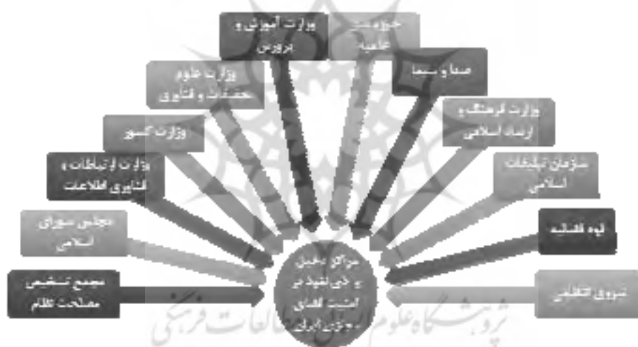
شکل شماره (۴): مراکز دخیل و ذی‌نفوذ در امنیت فضای مجازی ایران

به مقوله امنیت در فضای مجازی می‌توان از دیدگاه‌های مختلفی پرداخت، می‌توان امنیت اخلاقی، فرهنگی، اقتصادی و یا حتی سیاسی را در آن بررسی نمود و یا از جنبه فنی به امنیت در فضای سایبر نگاه کرد. در این بخش سعی می‌کنیم سازمان‌ها و نهادهایی که در امنیت فضای مجازی از جنبه‌های گوناگون دخیل هستند را به اختصار بررسی نماییم.