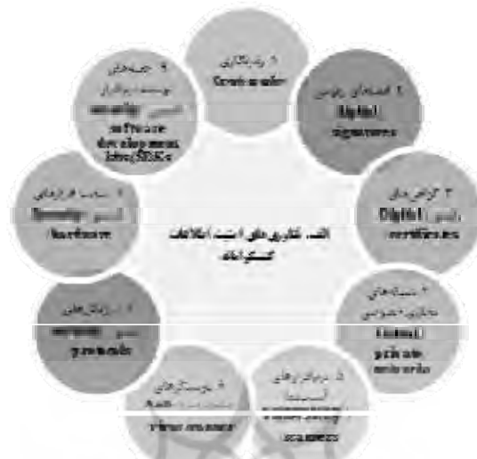
شکل شماره (۱): فناوری‌های امنیت اطلاعات کنش‌گرایانه