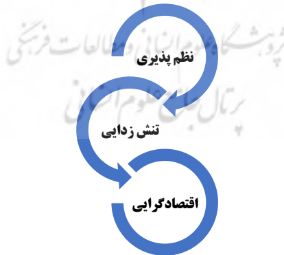
شکل شماره ۲: حلقه‌های مفاهیم سازنده گفتمان غرب‌گرایی موازنه‌گرا

رئیس دولت یازدهم و دوازدهم با درهم‌آمیختن آرمان‌های سیاست خارجی انقلاب اسلامی و جهت‌گیری‌های قانون اساسی در زمینه سیاست خارجی با رویکرد غرب‌گرایی موازنه‌گرا به دنبال سازش این دو جهت‌گیری با یکدیگر بود. امروز هم سیاست مردم ایران و سیاست دولت ایران که نشئت گرفته از اراده ملی است، بر دوپایه استوار است. در سیاست خارجی، یک پایه ظلم‌ستیزی، تجاوزستیزی، استقامت و ایستادگی استقلال و پایه دیگر، تعامل مؤثر و سازنده با جهان است. هر دو مؤلفه دو مؤلفه سیاست واحد هستند (روحانی، ۱۳۹۹/۸/۲۱).