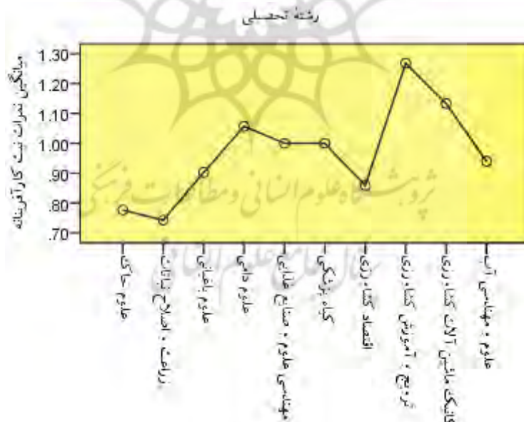
نمودار ۱. مقایسه قصد کارآفرینانه دانشجویان کشاورزی براساس رشته تحصیلی

نتایج ارائه شده در جدول ۴، نشان‌دهنده این بود که تفاوت معناداری از لحاظ آماری بین میانگین نمرات نگرش کارآفرینانه، هنجارهای ذهنی کارآفرینانه و کنترل رفتاری کارآفرینانه براساس رشته تحصیلی دانشجویان مورد مطالعه وجود نداشت. اما این نتیجه درخصوص متغیر قصد کارآفرینانه دانشجویان کشاورزی صادق نیست؛ به طوری که نتایج ارائه شده در جدول مذکور نشان داد که تفاوت معناداری از لحاظ آماری بین میانگین نمره متغیر قصد کارآفرینانه براساس رشته تحصیلی پاسحگویان وجود داشت. با توجه به معنادار بودن آزمون تحلیل واریانس از آزمون پس‌دامنه ۱ توکی ۲ برای بررسی تفاوت بین نمرات قصد کارآفرینانه در گروه‌های مورد مطالعه (رشته‌های تحصیلی) استفاده شد.