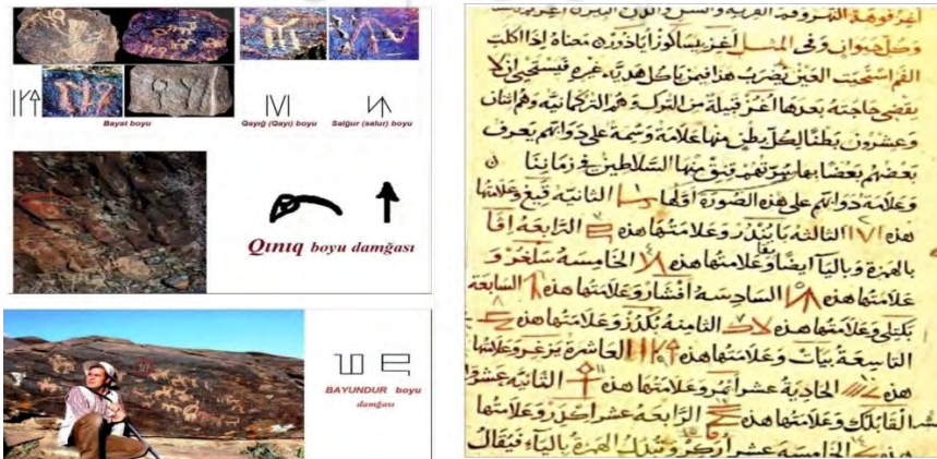
تصویر شماره-۶- تصویر دامغاهاى متعلق به قبایل ترک در دیوان الغات الترك و نمونه کهن تر همین دامغاها در فلات ایران

ج- احتمال دارد که قبل از تبدیل کامل این دامغاها به الفبای ترکی باستان، نوشتاری برآمده از هر دو نیز وجود داشته است که در حقیقت کتیبه مکشوفه در ناحیه «زاکالاتای کشور آذربایجان» شاهد قوی در این راستا می باشد .