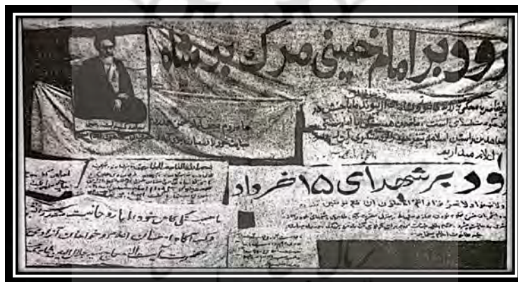
نمونه اعلامیه‌ها، پلاکارد و دست‌نوشته‌ها

(روزشمار انقلاب اسلامی به روایت اسناد و مدارک، ۱۳۸۳، ج ۳: ۲۶۸)