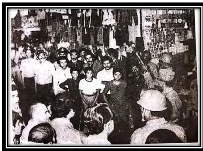
حضور ناجی در بازار اصفهان

(روزشمار انقلاب اسلامی به روایت اسناد و مدارک، ۱۳۸۳، ج ۳: ۲۸۸)