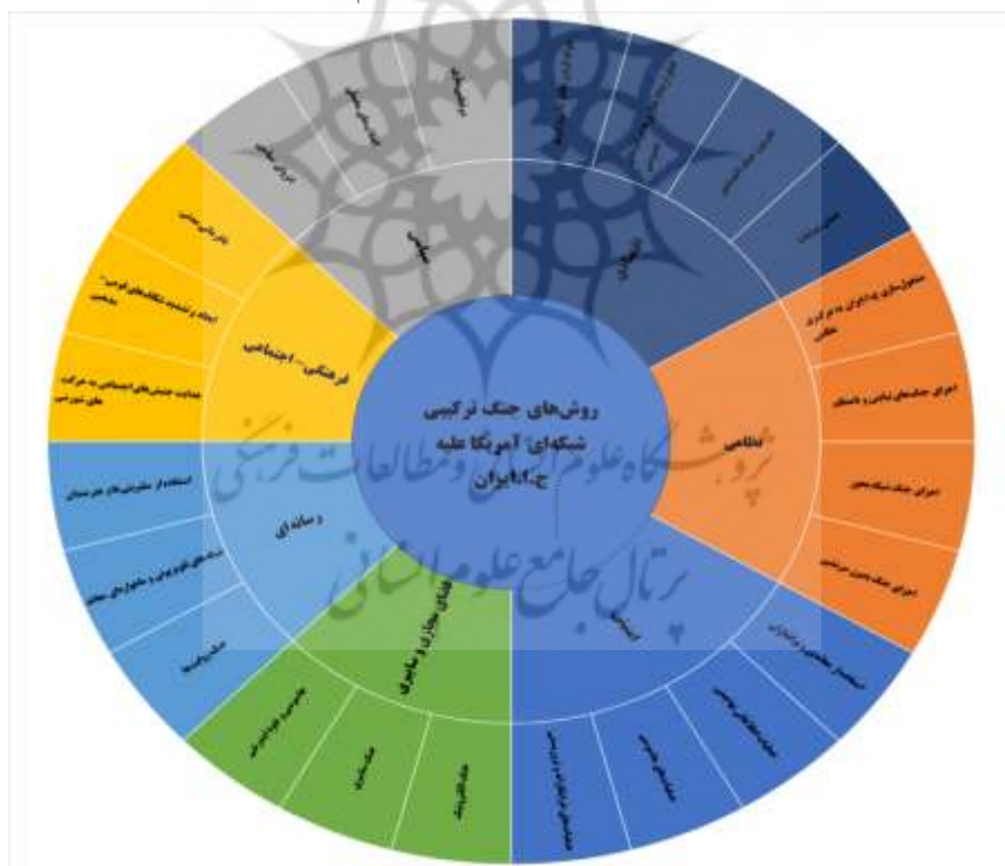
شکل شماره ۳: روش‌های جنگ ترکیبی شبکه‌ای آمریکا علیه ج.ا.ایران

جهت منزوی ساختن ایران و... مؤید آن است که روش تهدیدات امنیتی ایران به سمت ترکیبی شبکه‌ای پیش رفته است. بر اساس یافته‌های تحقیق در جدول شماره ۲ تعداد ۲۴ روش برای اجرای جنگ ترکیبی شبکه‌ای آمریکا علیه ج.ا.ایران در ۷ مؤلفه به ترتیب اولویت عبارت‌اند از: رسانه‌ای ۳ روش، امنیتی ۴ روش، اقتصادی ۴ روش، فرهنگی-اجتماعی ۳ روش، فضای مجازی و سایبری ۳ روش، نظامی ۴ روش و سیاسی ۳ روش است. روش رسانه‌ای در حد خوب مؤثر است، روش سیاسی در حد کم و روش‌های امنیتی-اقتصادی، فرهنگی-اجتماعی، فضای مجازی و سایبری و نظامی در حد متوسط در شکل‌گیری جنگ هیبریدی شبکه‌ای آمریکا علیه ج.ا.ایران مؤثر هستند. شایان ذکر است که برخی از روش‌هایی که در شکل زیر بیان شده است در شکل قبلی به‌عنوان عوامل شکل‌گیری در جنگ ترکیبی شبکه‌ای بیان شده است، به عبارتی دیگر برخی از عوامل جنگ ترکیبی شبکه‌ای همزمان به‌عنوان روش جنگ ترکیبی هم استفاده شده است.