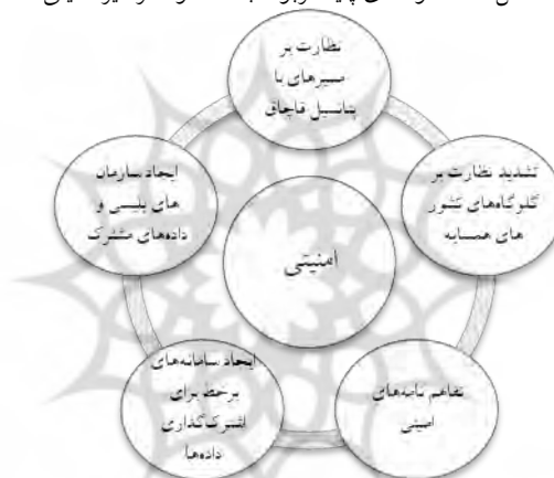
شکل ۱: مضمون‌های پایه مربوط به مضمون فراگیر امنیتی

در بررسی بعد کاربردی و اجرا در زمینه مبارزه با قاچاق کالا و ارز، می‌توان گفت راهکارهای موجود با تعداد ۲۳ مورد و در چارچوب ۷ مضمون فراگیر، حجم چشمگیری از مجموع راهکارهای ارائه شده را به خود اختصاص داده‌اند که مضمون فراگیر امنیتی، بیشترین گزاره را دارد. در ادامه هر یک از مضمون‌های مربوط به کاربرد و اجرا در چارچوب شکل‌های زیر دیده می‌شوند: