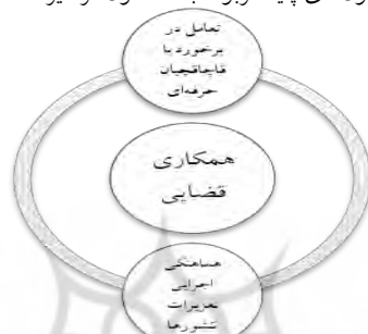
شکل ۶: مضمون‌های پایه مربوط به مضمون فراگیر همکاری قضایی

انجمن‌های مدنی، نقش فعالی در شکل‌دهی برنامه‌های جامعه دارد، زیرا نماد اصلی توانمندسازی انسانی است. بنابراین، این نوع رفتار نیروهای مدنی در جامعه‌های مردم‌سالاری که به خوبی کار می‌کنند، واکنش مناسب را دریافت می‌کنند. این واکنش‌های آشکار انبوه باید در توضیح نتیجه قانون مبارزه با قاچاق کالا و ارز، پیش از تغییر تمرکز از ارزش‌ها به نهادها مورد توجه جدی قرار گیرد.