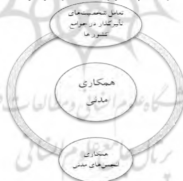
شکل ۵: مضمون‌های پایه مربوط به مضمون فراگیر همکاری مدنی

اتحادیه‌های صنفی در منطقه، حضور یا نمایندگی قوی در بخش‌های مربوط به فعالیت‌های قاچاق مانند: حمل و نقل، آماده‌سازی و گمرک ندارند. همکاری میان اتحادیه‌های صنفی در سراسر مرزهای منطقه، محدود است که می‌تواند مانع تبادل داده‌ها یا به اشتراک‌گذاری بهترین شیوه‌ها و تلاش‌های مشترک برای رویارویی با چالش‌های مشترک مربوط به قاچاق کالا و ارز شود. همکاری صنایع و اتحادیه‌ها، در جهت روان‌سازی تجارت و از میان رفتن گرایش به قاچاق کالا توسط تولیدکنندگان و اصناف در کشورهای آسیای مرکزی و قفقاز، در مهار کردن قاچاق مؤثر است.