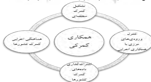
شکل ۷: مضمون‌های پایه مربوط به مضمون فراگیر همکاری گمرکی

قاچاق کالا و ارز می‌تواند با منافع سیاسی و اقتصادی، درهم آمیخته و به ایجاد حساسیت‌هایی منجر شود که ممکن است مانع همکاری شفاف و مؤثر قضایی شود. ملاحظات سیاسی ممکن است بر تمایل مقام‌ها، برای همکاری فرامرزی در مورد پرونده‌های مربوط به قاچاق تأثیر بگذارد. نبود یا محدود بودن محدوده «پیمان‌های همکاری حقوقی متقابل میان ایران و کشورهای آسیای مرکزی و قفقاز» می‌تواند سازوکارهای رسمی همکاری در گردآوری مدارک و اجرای درخواست کمک حقوقی را نابسامان کرده و بازگرداندن مظنونین مربوط به فعالیت‌های قاچاق را دچار پیچیدگی کند. بنابراین، همسوسازی و وحدت رویه میان نهادهای قضایی کشورهای این دو منطقه، پیرامون مبارزه با قاچاق و نهادینه کردن تسریع در پرونده‌های شهروندان می‌تواند مؤثر باشد.