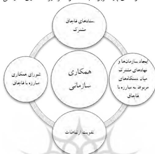
شکل ۳: مضمون‌های پایه مربوط به مضمون فراگیر همکاری سازمانی