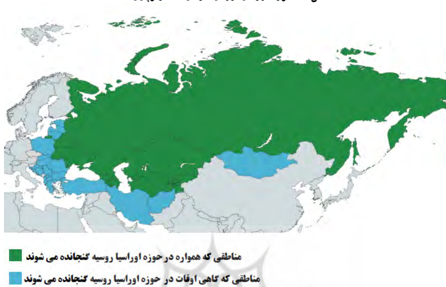
شکل ۱: حوزه اوراسیا روسیه از دیدگاه ژئوپلیتیک