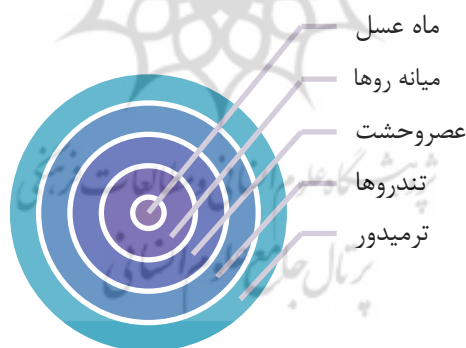
نمودار شماره ۲: دوره‌های انقلاب

ترمیدور دوره نقاهت پس از فرونشستن تب انقلابی می‌باشد. ویژگی این دوره استقرار نهایی خودکامه‌ای است که انقلاب او را به قدرت می‌رساند. در هر چهار انقلاب مدنظر برینتون، چنین دورانی تحقق یافت و همه آن‌ها دچار چرخش گردیدند. در این دوره، زندگی سیاسی، کم‌کم پایداری خود را باز می‌یابد. اما در حقیقت طعم خشونت سیاسی در کودتا، تصفیه‌ها و محاکمات مبتنی بر رعایت تشریفات قانونی، همچنان ادامه یافته و مردم کوچک و بازار نقشی در صحنه ندارند. به تدریج افراد تبعیدی اجازه حضور در کشور را پیدا می‌کنند و مشکلات پس از انقلاب به گردن تندروها می‌افتد. ابتدا همه در قالب نقش میانه‌روی، ولی سپس به محافظه‌کاری تغییر رویه می‌دهند؛ تا سرانجام با بازگشت دیکتاتوری و سلطنت، همه بازمانده‌های نظام‌پیشین در قالب چهره‌ای جدید به سرکار بازمی‌گردند (برینتون، ۱۳۶۶: 275-241).