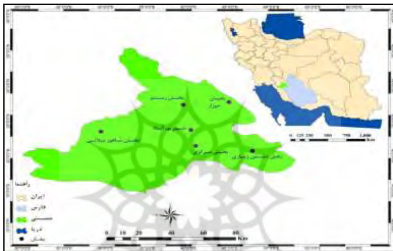
نقشه شماره (۱). موقعیت جغرافیایی شهرستان ممسنی

انتخابات را خواه برای کسب مقام سیاسی، خواه برای به‌رخ کشیدن ارزش‌ها و ایستار قلمرو طایفه‌ای خود، و خواه برای لذت بردن از فرایند سیاسی، فراهم کرده است. باوجوداین، متغیر انتخابات و مشارکت سیاسی، تحت تأثیر عوامل مختلف دیگری نیز قرار دارد و شکاف‌های اجتماعی دیگری نیز در طول دوره‌های گوناگون بر این حوزه انتخابیه تأثیر گذاشته و زمینه شکل‌گیری کارزار انتخاباتی چندشکافی را فراهم می‌کنند.