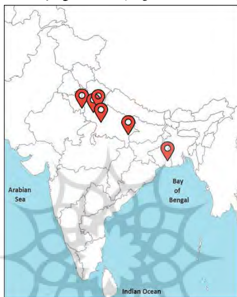
نقشه ۱. کانون‌های تدریس الأفق‌المبین در هندوستان

الأفق‌المبین را در جغرافیای شبه‌قاره، بدین صورت شناسایی کرد: