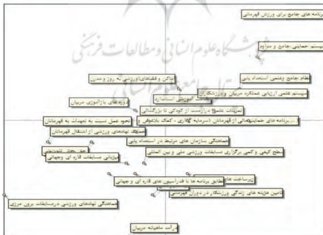
شکل ۱: پراکندگی عوامل مهم ورزش قهرمانی بر اساس تاثیرات مستقیم

بر اساس نتایج تحلیلی این ماتریس توسط نرم‌افزار میک‌مک، عوامل بازآموزی مربیان و اماکن ورزشی مدرن از جمله عواملی هستند که درجه تاثیرگذاری آن‌ها بسیار بیشتر از درجه تاثیرپذیری آن‌هاست. عوامل برنامه‌ریزی جامع، سیستم حمایتی مداوم، نظام جامع استعدادیابی، ارزیابی عملکرد و امکانات آموزشی استاندارد در بخش عوامل دو وجهی قرار گرفته‌اند که نشان می‌دهد این عوامل در ورزش قهرمانی کشور دارای نقش دوگانه تاثیرگذاری- تاثیرپذیری بالا هستند- بر اساس خروجی نرم‌افزار میک‌مک، عوامل تاثیرگذار و دووجهی که در منطقه شمالی شکل ۱ واقع شده‌اند، به عنوان عوامل کلیدی در ورزش قهرمانی کشور نقش حیاتی دارند و سیستم را تحت تاثیر قرار می‌دهند: