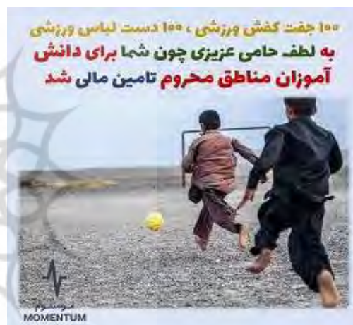
شکل ۲. تصویر علت‌محور با پیام مشارکت در علت