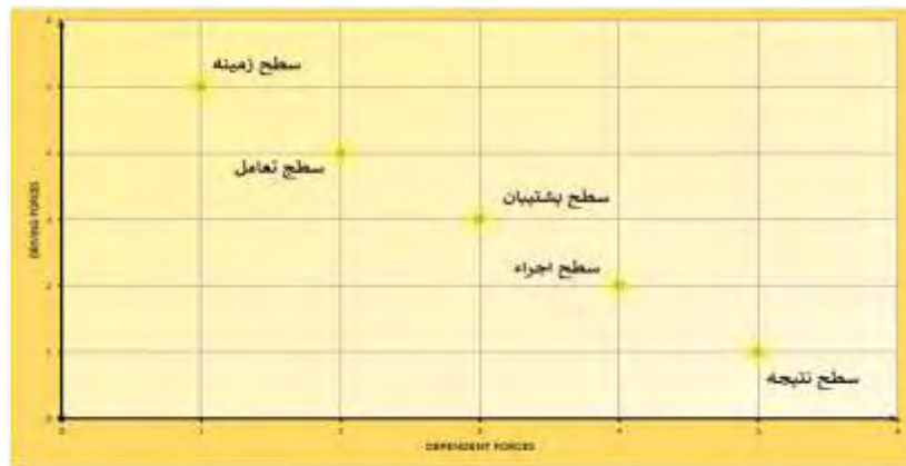
شکل ۲. میزان نفوذ و وابستگی سطوح خصوصی سازی باشگاه‌های ورزشی عراق

برای بررسی روابط الگوی مفهومی خصوصی سازی باشگاه‌های ورزشی عراق از مدلسازی معادلات ساختاری استفاده شد، که مدل استاندارد آن در شکل ۳ قابل مشاهده است.