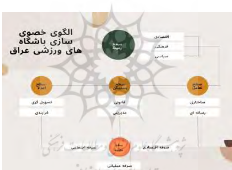
شکل ۱. الگوی مفهومی خصوصی سازی باشگاه های ورزشی عراق

پس از تعیین روابط و سطح بندی سطوح موصوف الگوی زیر در ارتباط با خصوصی سازی باشگاه های ورزشی عراق حاصل شد. بر مبنای این الگو و روابط بین متغیرها، خصوصی سازی باشگاه های ورزشی در عراق تابع پنج سطح است، در پایین ترین سطح عوامل زمینه ساز قرار دارد و در بالاترین سطح به عنوان خروجی سیستم سطح نتیجه قرار دارد. نحوه تعامل این سطوح (بنابر ماتریس خودتعاملی ساختاری) و اجزای آن در شکل ۱ نمایش داده شده است.