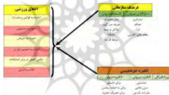
شکل ۱. مدل مفهومی پژوهش