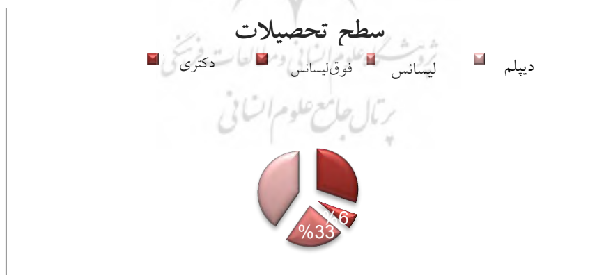
نمودار ۱. سطح تحصیلات شرکت‌کنندگان در مصاحبه

طبق مصاحباتی که با ۳۰ نفر از خبرگان صورت گرفت، این خبرگان متشکل از ۷ نفر داور (۲۳ درصد) ۷ نفر مربی (۲۳ درصد) و ۱۶ نفر بازیکن (۵۴ درصد) بودند که میانگین سنی آن‌ها ۳۷ \pm ۵ است و سابقه فعالیت ورزشی آن‌ها ۱۷ \pm ۵ است. سطح تحصیلات شرکت‌کنندگان در مصاحبه در نمودار ۱، در ادامه نمایان شده است.