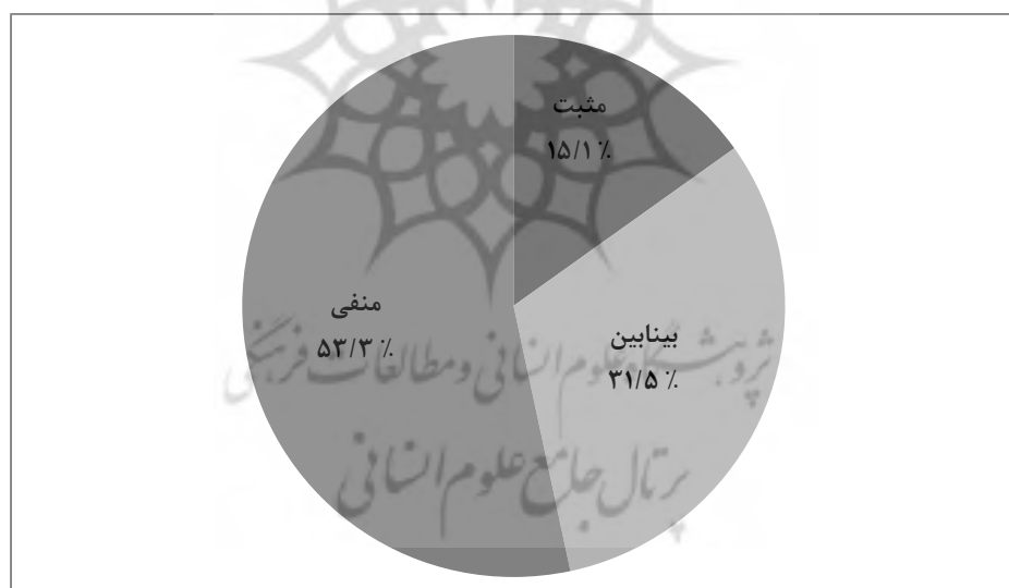
نمودار ۱: توزیع درصدی ارزیابی و تصور جوانان از پیامدهای اجتماعی و زندگی بعد از طلاق

بدین ترتیب، همانطور که نمودار ۱ نشان می دهد توزیع تصور پاسخگویان از پیامدهای اجتماعی و زندگی بعد از طلاق نشان می دهد که ۱۵ درصد تصور و ارزیابی مثبت از پیامدها و زندگی بعد از طلاق دارند. در مقابل، ۵۳ درصد تصور و برداشت منفی از طلاق و پیامدهای آن در جامعه ایران دارند و حدود ۳۲ درصد نیز در وضعیت بینابین قرار دارند.