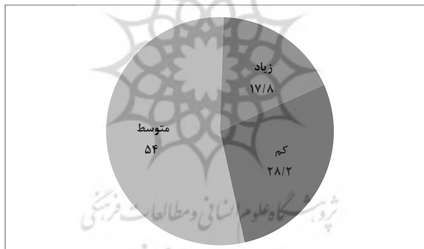
نمودار ۳: میزان گرایش و تمایل جوانان مورد بررسی به طلاق (%)

با توجه به نتایج تحلیل عاملی و نمره عاملی به دست آمده شاخص، میزان تمایل و گرایش به طلاق در سه گروه طبقه‌بندی شد که نتایج آن در نمودار ۳ ارائه شده است. بر این اساس، ۲۸ درصد تمایل و گرایش کم و حدود ۱۸ درصد تمایل و گرایش زیادی به طلاق داشته‌اند. همچنین، ۵۴ درصد در این باره وضعیت متوسط و بینابینی داشته‌اند.