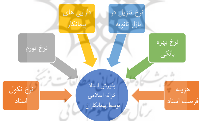
نمودار (۱) مدل پژوهش

قلمرو مکانی این تحقیق شامل پیمانکاران طرح های عمرانی در مناطق مختلف می باشد. که از بین این گروه های متخصص بصورت تصادفی نمونه گیری با استفاده از جدول مورگان صورت می پذیرد. با توجه به کیفی بودن برخی داده ها و جمع آوری داده ها از طریق پرسشنامه، در این تحقیق از معادلات ساختاری در قالب مدل ذیل استفاده می شود.