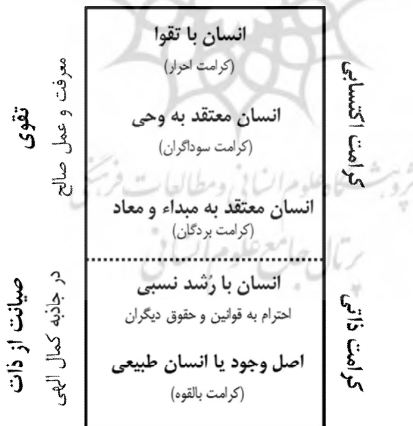
شکل ۳: مراتب کرامت انسان الهی

دو نوع کرامت ذاتی و اکتسابی قائل است (جوادی آملی، ۱۳۶۷: ۲۱۳؛ اله‌باشتی، ۱۳۸۸؛ محسنی، ۱۳۹۳):