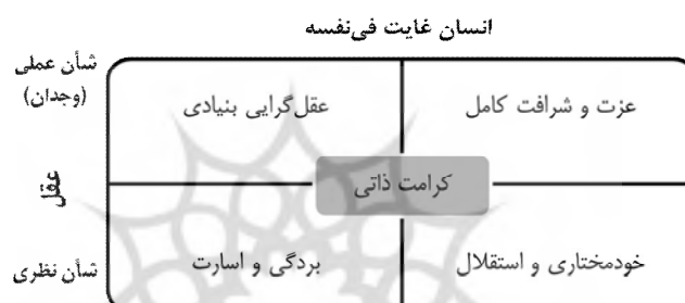
استقلال و اراده‌ی آزاد شکل ۴: ابعاد کرامت انسانی انسان اخلاقی

معیار کرامت: معیار کرامت، انسانیت است. انسان مانند حیوان، موجودی زنده است که حس صیانت از ذات، تمایل به حفظ نوع و استعداد ادراک لذت را دارد؛ با این تفاوت که ناطق و دارای احساس ابراز همدردی و ارتباط با دیگران است (اعوانی، ۱۳۸۶). کرامت انسانی از منظر کانت، همان کرامت ذاتی انسان است با محوریت عقل و استقلال و اراده آزاد. در حقیقت؛ انسان اخلاقی کانت خود غایت فی‌نفسه است. (شکل ۴)