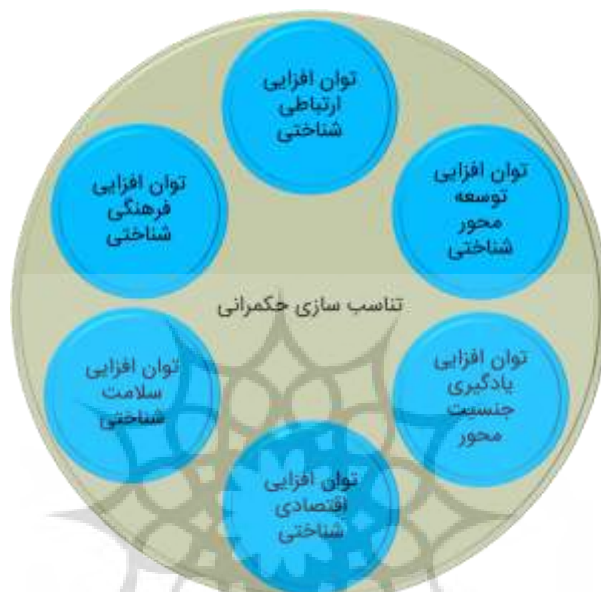
شکل ۳. چارچوب پیشنهادی برای توانمندسازی زنان در حوزه حکمرانی بر اساس مطالعات علوم شناختی

براساس شابلون نظری ایجاد شده و همچنین سیرتکامل مطالعات مرتبط با علوم شناختی به خصوص آنانکه بر روی توانمندسازی و توسعه مهارت‌های شناختی متمرکز شده بودند، چارچوب زیر استخراج می‌گردد.