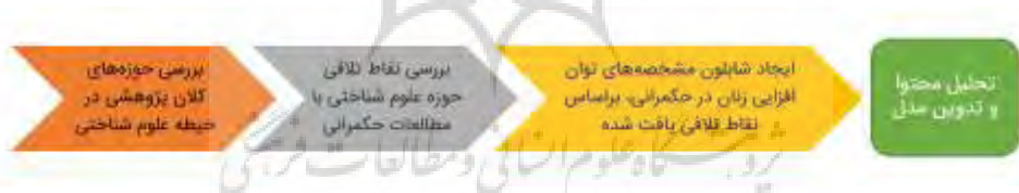
شکل ۱. فرایند مسیریابی پژوهش.

در راستای مسیریابی فرایند پژوهش با هدف رسیدن به یک مدل مفهومی جامع برای توانمندسازی زنان در حوزه حکمرانی بر اساس بافتار و لنز نظری علوم‌شناختی، مسیر ذیل همانند آنچه در شکل شماره ۱ نشان داده شده است، طی گردید.