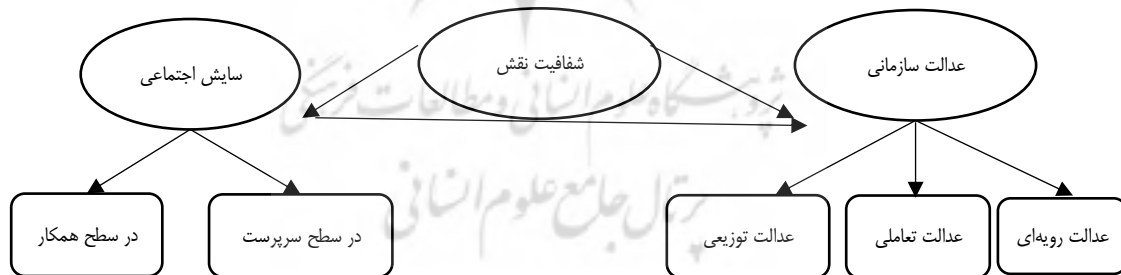
شکل ۱. الگوی مفهومی پژوهش

در شکل ۱ الگوی مفهومی پژوهش حاضر نشان داده شده است.