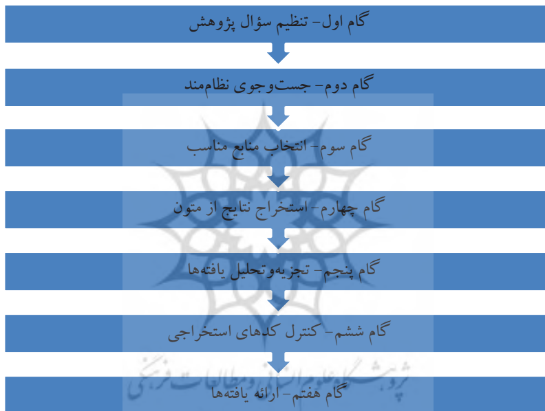
شکل ۱. هفت گام فراترکیب (Sandelowski and Barroso 2007)

در مرحله فراترکیب، مدل (Sandelowski and Barroso (2007 که در پژوهش‌ها بیشتر از سایر مدل‌ها به کار رفته است، انتخاب شد. در پژوهش حاضر نیز از این مدل برای انجام فراترکیب استفاده شد. مراحل روش «سندلوسکی و باروسو» به شکل زیر است: