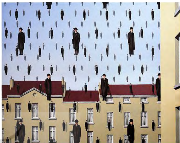
تصویر ۱. گولکوند (۱۹۵۳).

رفته‌اند تا موقعیت بهتری برای غلبه بر جامعه (زنان) به دست آورند؛ وقتی تکنولوژی و فضای مجازی بر شهر غلبه کرد، انسان‌ها ابتدا شبیه به هم شده و سپس یکی‌یکی سبک‌وزن شده و به هوا رفته‌اند یا شاید این صحنه، نمودی از همان برادر بزرگ ۲۳ مشهور باشد که جورج اورول در ۱۹۸۴ از آن می‌گوید؛ شخصیتی نادیدنی که حالا در یک نمایش عروسکی، حضور فیزیکی دارد و ناظر بر تمام فعالیت‌ها و زندگی شهروندان است.