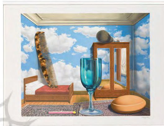
تصویر ۳. ارزش‌های شخصی (۱۹۵۲).

گیلاس (لیوان) و صابون و یک چوب کبریت بسیار بزرگ روی زمین قرار دارد و فرچه آرایش صورت غول‌پیکر روی کمد آرمیده است. دیوارهای اتاق با تصویر آسمان آبی همراه با ابرهای سپید پوشانده شده؛ گویی کاغذ دیواری با چنین طرحی آن را پوشانده است. چنین تصویری در بستر نمایش عروسکی به راحتی می‌تواند به تئاتر تبدیل شود؛ چراکه اشیای بزرگ‌شده هم با ویژگی کوچک‌سازی و بزرگ‌سازی در تئاتر عروسکی هماهنگ هستند و هم می‌توانند وجهی نمادین داشته باشند و هم با اندازه بزرگشان وجهی خیالی در زمینه واقعی می‌سازند؛ از این رو کل فضا را دارای ماهیتی فانتاستیک می‌کنند.