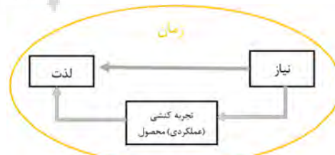
تصویر ۱. نقشه راه پژوهش.

در این پژوهش، هدف واکاوی اثر زمان بر تجربه لذت است که انسان در تعامل با محصول و کنش آن درک می‌کند. فهم این که چگونه لذت ناشی از کنش برخی از محصولات علی‌رغم گذر سال‌ها همچنان از گزند زمان محفوظ می‌ماند و اینکه کدام زمان از تعامل ما با محصول، زمان اصیل است. در واقع پاسخ به این پرسش مدنظر است که آیا لذت ناشی از تجربه عملکردی (کنش) محصول در زمان‌های مختلف می‌تواند حامل معنای متفاوتی برای کاربر باشد یا خیر. به همین منظور، ابتدا آرای فلاسفه در خصوص زمان و دسته‌بندی‌هایی که برای درک آن ارائه شده و تمرکز بر زمان اصیل که در نظر برگسون ۲ و هایدگر ۳ از دید روانشناسی بازتعریف گردید، بررسی شد. سپس، خاستگاه لذت و در نگاهی کلی‌تر، نیاز، مطالعه گردید. به منظور درک اثر زمان بر لذت کنش ناشی از محصول، چرایی و چگونگی تجربه لذت و کنش محصول در طول زمان واکاوی شد (تصویر ۱). در نهایت برای فهم بهتر مطالب، سیر زمانی سه محصول بررسی می‌شود. دور از انتظار نخواهد بود که طراحان محصول و خدمات با اتخاذ نگرشی متفاوت به زمان، فرایند طراحی را به گونه‌ای طی کنند که توجه به زمانمندی، سبب پایداری طرح گردد.