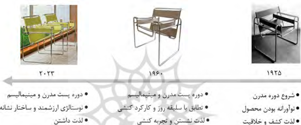
تصویر ۵. سفر زمانی صندلی واسیلی و تطابق تفکر حاکم بر جامعه، نوع کنش و نوع لذت و مرتبه نیاز.

خود را بر روی آن منعکس می‌کردند. در طراحی این محصول، خطوط منحنی صاف فولکس واگن به شدت تحت تأثیر ساده‌سازی عملکردی ماشین‌ها و قطارها در دهه ۱۹۳۰ م. بود. انحناهای گرد فولکس واگن، به طرز مطمئنی ارگانیک بود، نه مکانیکی و تهدیدآمیز. بنابراین باعث فراموشی شرایط غیرانسانی شد که در نهایت تحت آن تولید می‌شد.