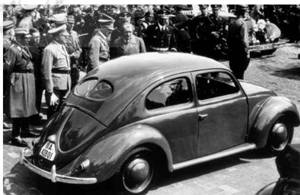
تصویر ۶. خودرو تولید شده در آلمان.

ایده آدولف هیتلر در مورد خودرو ملی آلمان، خودرویی مقرون به صرفه بود که بتواند یک خانواده پنج نفری را در خود جای دهد و عموم مردم توانایی خرید آن را داشته باشند. او زمانی که به تازگی به مقام پیشوایی آلمان رسید این ایده را با فردیناند پورشه در میان گذاشت. در سال ۱۹۳۶ اولین طرح نهایی این اتومبیل تولید شد (تصویر ۶).