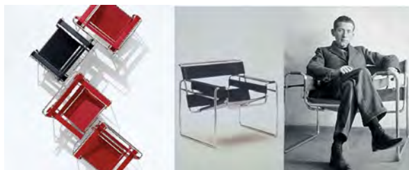
تصویر ۴. صندلی واسیلی با طراحی مارسل بروئر.

بار، دوران مناسب و عالی برای درخشش صندلی واسیلی بود.