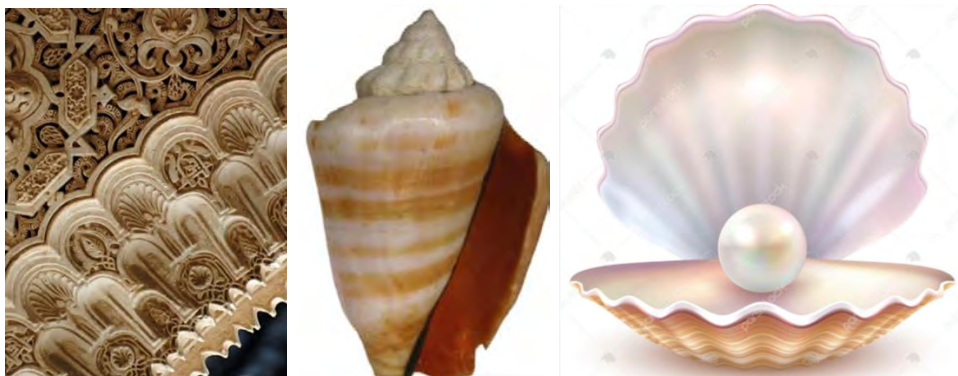
تصویر ۲. راست: مروارید درون صدف نماد پاکدامنی و منسوب به آب، که از این رو به دوشیزه آن‌هیتا ایزدبانوی آب‌های پاک و باروری، زایش و نجابت است، وسط و چپ: صدف حلزونی که در تزئین برخی از محراب‌ها کاربرد داشته است.

بورکهارت (همان، ۱۵۶) مطرح می‌کند: «ماهی و مروارید با گوش انسان و کلام الهی متناظر است». گوش ماهی یا صدف که مروارید در آن نهفته است. از نمادهای الهه‌های آب هستند که در ایران به آن‌ها نسبت داده شده و هر آنچه مربوط به آب است به این ایزد بانو منسوب است. اما ارتباط گوش با گوش ماهی تعبیری عجیب است!