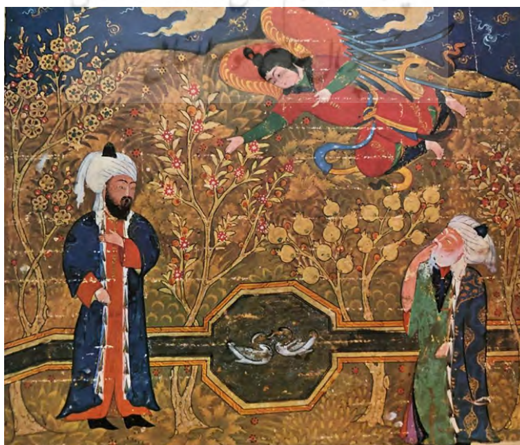
تصویر ۳. ستایش حضرت علی (ع) توسط جبرئیل در حضور پیامبر (ص)، مکتب شیراز قرن نهم هجری.

«در مینیاتور چشم‌انداز بی‌سایه (نبودن Perspective) که در آن هر چیزی از جوهری به غایت لطیف و پر ارج ساخته شده است و در آنجا هر درخت و گلی در نوع خود بی‌نظیر، درست مانند گیاهانی که دانته در بهشت زمینی خود بر کوه اعراف قرار داده است، به‌طوری که بذره‌های آنها به‌وسیله بادی جاودانه که بر قلّه کوه می‌وزد، به اطراف برده می‌شود تا همه گیاهان روی زمین را به وجود آورد. چیزی را که مینیاتور به‌نحو غیرمستقیم توصیف می‌کند. ماهیات ازلی و اعیان ثابتۀ اشیا است، به‌طوری که در آن یک اسب صرفاً فرد خاصی در یک نوع نیست، بلکه اسب به مفهوم مطلق است. هنر مینیاتور در صدد فهم و ادراک صفات نوعی است» (همان). داستان سربازی و نسبت‌دادن حال و هوای مینیاتور به عالم غیرواقعی! درحالی‌که صحنه‌های مینیاتور در باغ و بوستان روی داده و عناصر آن واقعی است. گل و گیاه، درخت، حوض آب در باغ و حیاط ایرانی، اتاق، ایوان، سرپرده و پنجره‌ها همه واقعی و حکایت از معماری و فضاهای باغ و حیاط دارد. نویسنده در این مقاله ادامه می‌دهد: «مینیاتور ایرانی، به‌دلیل خصوصیات معیاری آن می‌تواند برای بیان شهود عرفانی مورد استفاده قرار گیرد. این کیفیت خاص تا اندازه‌ای ناشی از جو شیعی است که در آن حد فاصل میان شریعت و الهام به مراتب کمتر از عالم تسنن است. نظر ما در اینجا مینیاتورهای خاصی است که موضوع دینی دارد، مثلاً مینیاتورهایی که