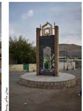
تصویر ۳. میدان متأخر جایگزین میدان میل به‌مثابهٔ یک میراث تاریخی و آیینی و مرکز روستا.