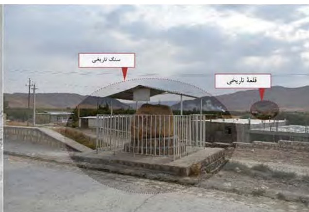
تصویر ۱. تحلیل سایت میراثی در محدوده قلعه باستانی و سنگ تاریخی روستای خسروآباد و ظرفیت نظرگاهی روستا بر سایت میراثی، مأخذ: نگارنده با استفاده از GOOGLE EARTH