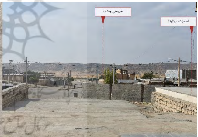
تصویر ۲. عدم خوانش امامزاده و خروجی چشمه به‌مثابهٔ یک منظر در طرح‌های روستا خسروآباد.