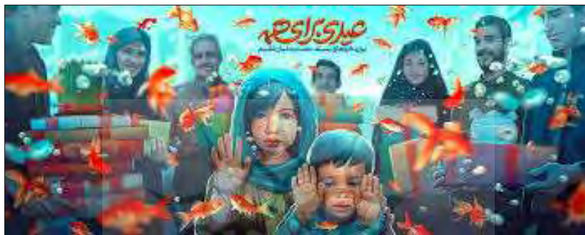
شکل ۲. عیدی برای همه (جشن نیکوکاری). دیوارنگاره میدان ولی عصر (عج)

را وسعت می‌بخشند. بر انفاقات و صدقات (از جمله جشن نیکوکاری) نیز بارها در قرآن و احادیث تأکید شده است و حسنات زیادی برای آن‌ها احتساب کرده‌اند. سه تأثیر مهمی که اهدا و نذر در روابط اجتماعی شهروندان در سطوح فردی و اجتماعی دارد: اول گسترش آن در جامعه نقش غیرقابل انکاری در فراهم کردن معاش افراد نیازمند جامعه، کاستن فقر و برقراری برابری اجتماعی و تراز ثروت اجرا می‌نماید. اثر دوم تشدید روحیه برادری و وحدت اجتماعی بین مسلمانان، و همچنین پیروان سایر ادیان و مکتب‌های الهی و حتی غیرالهی است که از آن‌ها پیکره واحدی را می‌سازد. تأثیر سوم مصون داشتن جامعه از تحصیل هزینه‌های ناشی از حسد و کینه اقشار فقیر نسبت به غنی است و از این طریق اعتبار سرمایه اجتماعی را در جامعه افزایش می‌دهد. از این رو، تعامل و ارتباطی دوسویه بین جشن نیکوکاری با سنت و سرمایه اجتماعی پارچا است (شکل ۲) (Niazi & Karkonan Nasrabadi, 2016).