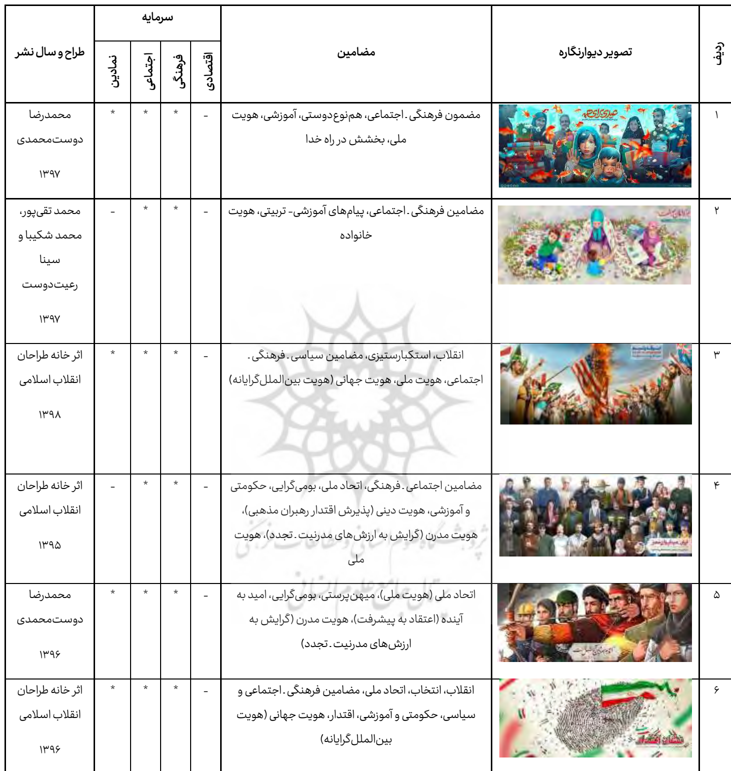
جدول ۲. خصوصیات دیوارنگاره میدان ولی‌عصر (عج)