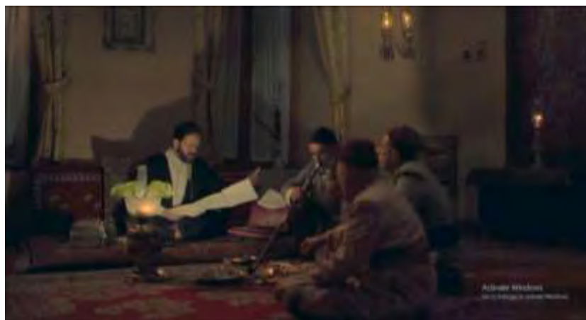
شکل ۳. فیلم شطرنج باد، دقیقه ۶۰:۰۶.

«در تابلوی نساخان (استنساخ)، که کاری است منفرد، و نمونه دیگری ندارد، او آن سوی نگارگری ما رفته. در نگارگری، اگر سایه حذف می‌شود اینجا سایه خود اصل موضوع است. سایه‌ها نقشینه‌های اصلی‌اند و به سطوح، شکل می‌دهند. چهره‌ها، در ابعاد شکسته کوبیست نموده شده‌اند. چین لباس‌ها، سطوح شکسته سایه‌ها حضور دارند و افراد در شکست سایه‌ها، گم می‌شوند» (Aslani, 1995, 65). سایه‌ها عملکرد خود را دارند و اینجا سایه‌ها حس را منتقل می‌کنند و به آنچه در پشت پرده می‌گذرد اشاره دارند. اصلانی در ادامه می‌گوید: «نور در اینجا پرسپکتیو ایجاد نکرده بلکه مجموعه‌ای از سایه‌های همسطح اما متناقض آفریده است که می‌توان در آن وضعیت هراس‌بار چند تنی را دید که به کاری شاید ممنوع می‌پردازند، یا کاری که نمی‌توان دید، تومارها در نور چراغ موشی به سایه‌هایی هم‌سنگ آدم‌ها بدل شده‌اند. حاکمیت وضعیت نگار سایه‌ها، و تجزیه همه نقشینه‌ها به سطوح متضاد و به این ترتیب آفرینش یک مفهومی متضاد از وضعیت» (Ibid, 66).