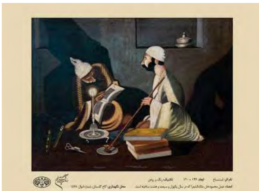
شکل ۲. تابلو استنساخ نسخه رنگ و روغن ۱۳۸۸، مأخذ: URL 2

«سایه روشن روش کاریست رنگ سایه‌های تیره و روشن به منظور بازنمایی حجم اشیا و جانداران، وضعیت آن‌ها در ارتباط با فضای معین و نیز برای ایجاد جلوه‌های هیجان‌انگیز است» (Pakbaz, 2007, 297). در این تابلو، نور شمع سایه‌ای شدید در پس‌زمینه به وجود آورده و چهره‌ها را روشن کرده است. هم‌چنین، تضادی شدید بین تیره و روشن، در تابلو شکل گرفته است. تابش نور نسبتاً یکدست به کمک خطوط منحنی، از فیگور سمت راست چهره‌ای با آرامش همراه با انتظار ساخته است. با وجود این‌که «نور از یک سمت در چهره سمت راست تابیده است، اما تیرگی و کنتراستی در کلاه و گردن او دیده نمی‌شود. چهره او بسیار مات، خیره و حالتی آرام دارد. البته خطوط منحنی ریش‌ها، کلاه، لباس و قسمت پشت فیگور، فوق‌العاده در این آرامش مؤثرند. درحالی‌که، نور در چهره سمت چپ کنتراستی شدید ایجاد کرده و حالتی غیرمعمول، وهم‌آلوده و اکسپرسیوون به وجود آورده است» (Salehi, 2017, 92).