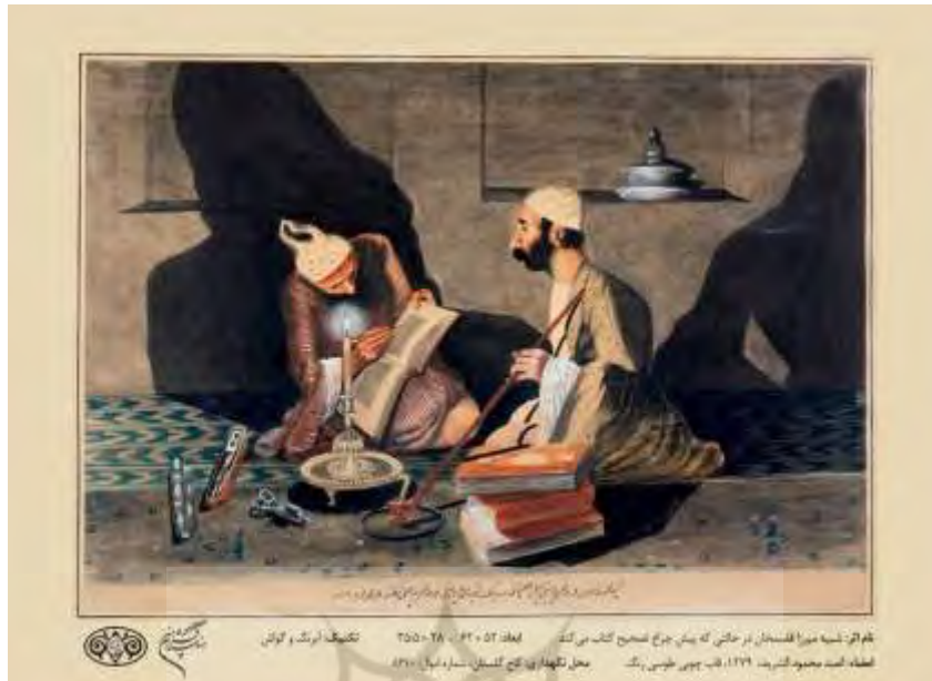
شکل ۱. تابلو استنساخ نسخه آبرنگ ۱۳۷۹

نیم‌دایره و کره، در برخورد با حجم‌های مثلث و مستطیل‌گونه دریافت و این تعمد در نشان‌دادن سایه‌ها شکلی اغراق‌آمیز می‌گیرد» (Mojabi, 2005, 167).