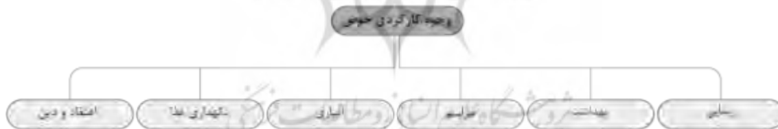
نمودار ۲- برشماری وجوه کارکردی حوض در معماری خانه‌های قاجاری لاهیجان

در مطالعات میدانی انجام شده مبنی بر کارکرد حوض، استفاده از حوض به عنوان نوعی یخچال خانگی برای خنک نگاه داشتن برخی مواد غذایی، در مرتبه پایین‌تر قرار می‌گیرد. با توجه به خصوصیات جغرافیایی گیلان، نزدیک هر حوض یک چاه آب قرار گرفته که اغلب آب این چاه و گاهی آب حوض برای آبیاری باغچه و اشجار و یا برای پرکردن مخازن آب در سرویس‌های بهداشتی استفاده می‌شده است. با عنایت به کارکردهای چندگانه فوق، عموماً حوض را عمیق می‌ساختند. اگرچه عمق حوض حاکی از اهمیت نگهداری آب است، اما جنبه زیبایی‌شناسی آن نیز مهم است. با گذر ایام، توجه به بعد اعتقادی و نمادگونه حوض که از مهم‌ترین خصیصه‌های حوض در معماری پیش از قاجار بود، کاسته شد و کارکردهای مادی آن در کنار زیباسازی محوطه حیاط اهمیت بیشتری یافت. در نمودار ۲ وجوه کارکردی حوض در خانه‌های لاهیجان به ترتیب و با توجه به تأکید مصاحبه‌شوندگان در مصاحبه‌های غیررسمی انجام‌گرفته، از راست به چپ معرفی شده است.