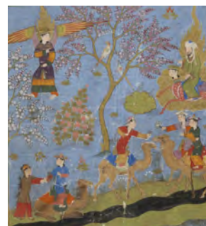
تصویر ۱۲. حضرت محمد (ص) حوریانی که در روزهای جمعه شترسواری می‌کنند را مشاهده می‌کند.