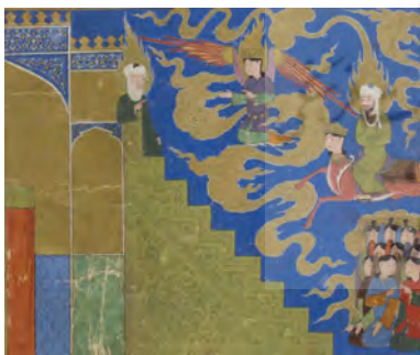
تصویر ۷. حضرت محمد (ص) ابراهیم پیامبر که بر منبر نشسته را ملاقات می‌کند.

۴. ۱. ملاقات با حضرت ابراهیم با منبری از زمرد سبز (تصویر ۷) ۳۲ بیش‌متن، به عمارت و منبری بزرگ از زمرد سبز اشاره می‌کند. در مورد ساختار فضا، مطلب دیگری ارائه نشده است. در بیش‌متن، هنرمند با خلاقیتی قابل‌توجه برای خلق فضا، با برشی مورب به جهت چینش عناصر، اقدام به تفکیک فضا کرده است. بالا سمت راست، آسمان و ابرهای سماوی نورانی و پایین سمت چپ، عمارت و منبری توأم با تزئینات اسلامی است. در پیش‌متن اشاره‌ای به تزئینات و امکانات بیانی رنگ در فضا و ترکیب‌بندی خلق شده برای چینش عناصر نمی‌توان یافت؛ این امر دلیلی بر افزایش و گستردگی بیش‌متن در فضایی جدید در گونه