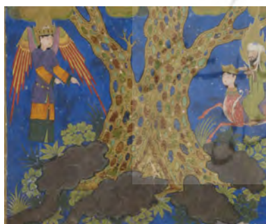
تصویر ۱۱. حضرت محمد (ص) به درخت سدره‌المنتهی می‌رسد.

پیش‌متن، به دیدار درخت سدره‌المنتهی با شاخه‌هایی از یاقوت سبز، زبرجد، مروارید و برگ‌هایی چون گوش‌های فیل و میوه‌هایی بزرگ اشاره می‌کند. از ریشه این درخت دو رود فرات و نیل جاری است. در ادامه از دو رود محصور، سلسبیل و کوثر با رنگی سفیدتر از شیر یاد شده است. ۴۰ در بیش‌متن علاوه‌بر شاخه‌ها، پیکر درخت نیز از سنگ‌های یادشده شکل گرفته است. حضور عناصری چون میوه‌های