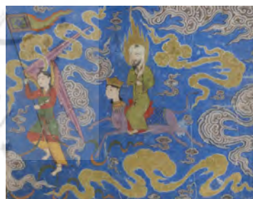
تصویر ۲. ورود حضرت محمد (ص) به آسمان اول که از مینای فیروزه‌ای ساخته شده است.