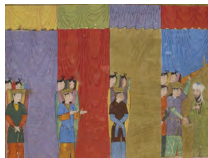
تصویر ۸. حضرت محمد (ص) به کمک فرشتگان از هفتاد هزار پرده عبور می‌کند.