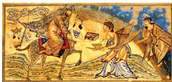
تصویر ۱۵. معراج پیامبر، جامع‌التواریخ، کتابخانه دانشگاه ادینبورگ.