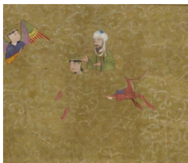
تصویر ۱۳. حضرت محمد (ص) در آسمان هفتم که از نور ساخته شده است پرواز می‌کند.