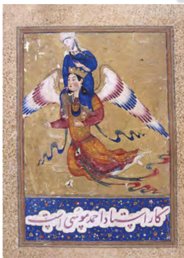
تصویر ۱۶. حضرت محمد (ص) بر دوش جبرئیل از آسمان هفتم عروج می‌کند.