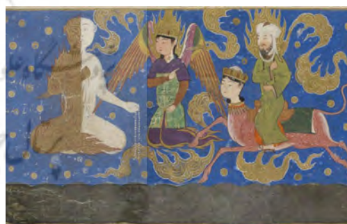
تصویر ۱۰. حضرت محمد (ص) فرشته نیمی از آتش و نیمی از برف را ملاقات می‌کند.