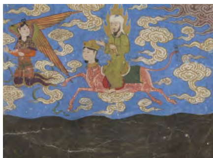
تصویر ۹. حضرت محمد (ص) بر فراز دریایی به نام کوثر پرواز می‌کند.