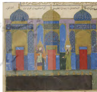
تصویر ۶. حضرت محمد (ص) پس از ورود به بهشت از حوض کوثر دیدار می‌کند. منبع: (URL1)