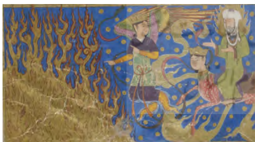
تصویر ۳. حضور حضرت محمد (ص) در سواحل دریای آتش.

در پیش‌متن، پیامبر دریایی از آتش را مشاهده می‌کند که در روز رستاخیز به جهنم خواهد ریخت و ساکنان آن را عذاب خواهد داد. ۳۳ نگارگر در پیش‌متن با برش فضا، در گوشه‌ای از کادر، حرکت موج و زبانه‌های شعله‌آسای این دریا را به صورت نمادین به تصویر کشیده است. در پیش‌متن، عناصری چون رنگ، پاره ابرهای سحابی موج، ستاره‌ها، نحوه استقرار و ترکیب‌بندی آن وجود ندارد. در پیش‌متنیت، با تراگونگی