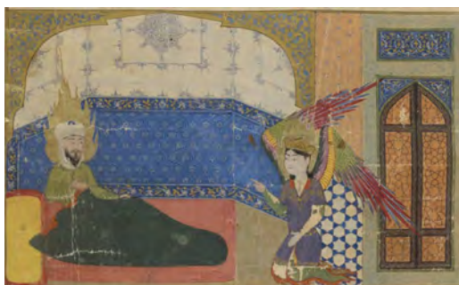
تصویر ۵. جبرئیل در مکه ظاهر می‌شود و عروج حضرت محمد (ص) را اعلام می‌کند.