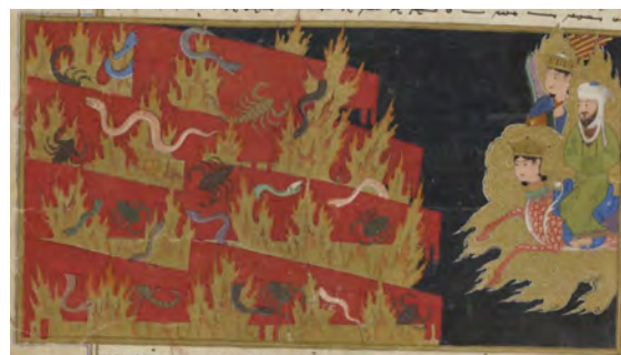
تصویر ۴. مجازات متکبران.