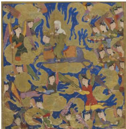
تصویر ۱. حضرت محمد (ص) سوار بر براق به همراه جبرئیل در آغاز سفر از مکه به بیت‌المقدس.

در خوانش بیش‌متنی در پیش‌متن سفر آسمانی پیامبر اکرم (ص) با گام برداشتن براق در آسمان همچون یک پرنده آغاز می‌شود. فرشتگانی با هفتاد هزار پرچم از نور، توأم با هفتاد هزار فرشته دیگر در کنار هر پرچم به استقبال آمده‌اند. ۲۱ در متن تصویری، بیست و پنج فرشته و یک پرچم با عنصر نوشتاری الله وجود دارد. از این رو با کاهش چشمگیر فرشتگان، پرچم‌ها و افزایش آسمان لاجوردی، ابرهای مارپیچ، اشیا و ظروفی که فرشتگان در دست دارند، مواجه می‌شویم. این عناصر در