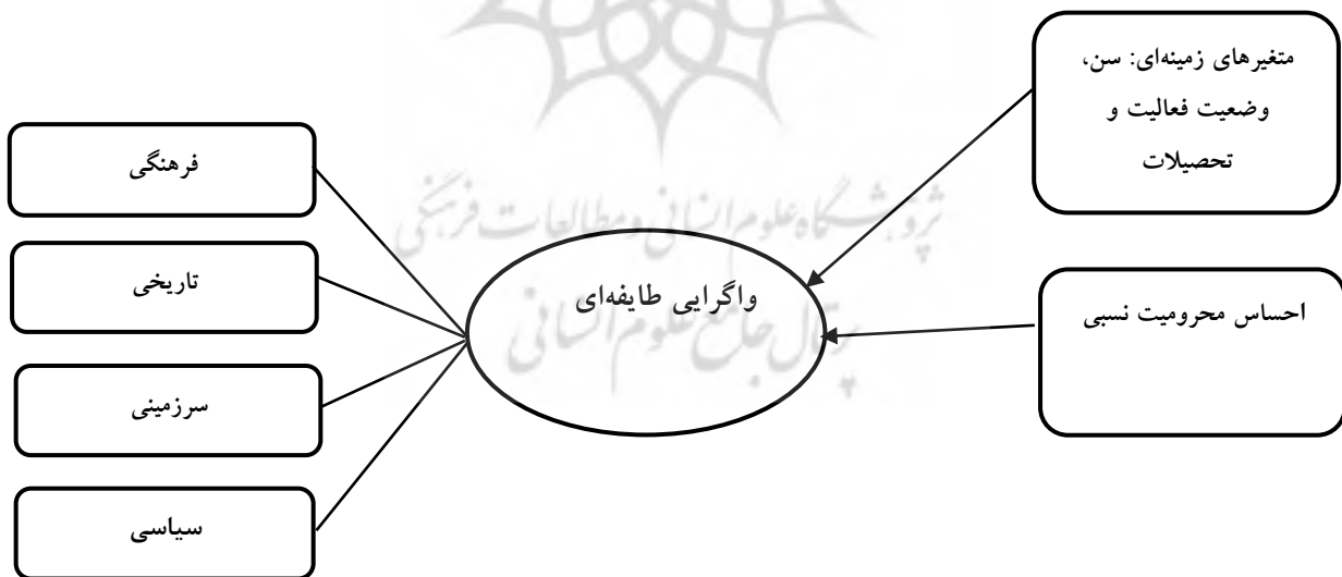
شکل ۱- مدل مفهومی پژوهش