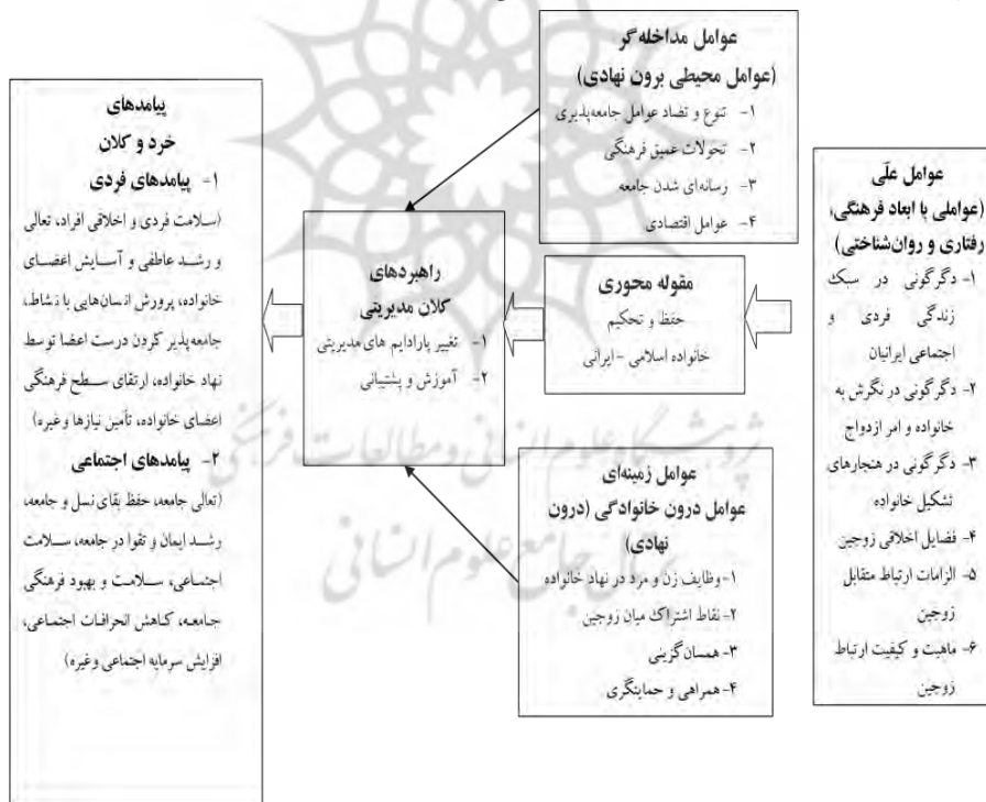
نمودار ۲: مدل پارادایمی عوامل مؤثر بر حفظ و تحکیم خانواده اسلامی - ایرانی

یافته‌های پژوهش حاضر، در راستای پاسخگویی به سؤال اصلی پژوهش مبنی بر اینکه عوامل اثرگذار بر حفظ و تحکیم خانواده اسلامی - ایرانی کدام است؟ مبین آن بود که عواملی در سه سطح «علی»، «زمینه‌ای» و «مداخله‌گر» که مبین عواملی با ابعاد فرهنگی، رفتاری و روان‌شناختی (عوامل علی)، عوامل درون‌خانوادگی یا دورن‌نهادی (عوامل زمینه‌ای) و نیز عوامل محیطی برون‌نهادی (عوامل مداخله‌گر) هستند، بر حفظ و تحکیم خانواده اسلامی ایرانی اثرگذارند که این عوامل، ارکان مدل پارادایمی پژوهش حاضر که مبتنی بر روش پژوهش داده‌بنیاد است را شکل می‌دهند.