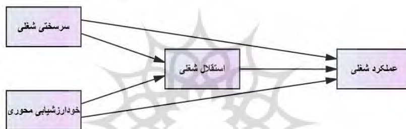
شکل (۱) مدل مفهومی پژوهش